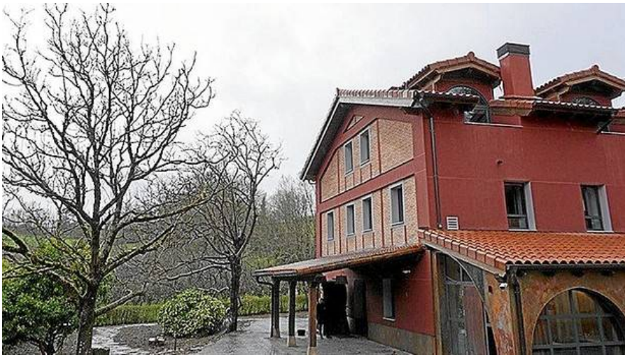
Exterior del hotel Sagalore de dos estrellas, en Astigarraga, que abrió en abril.