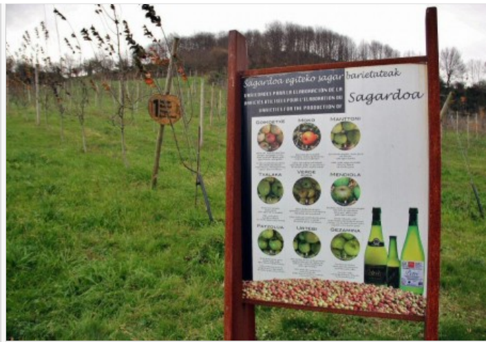
Enoturismo en sidrería Petritegi en Astigarraga

Cada año el honor de la primera degustación le corresponde a alguna celebridad del País Vasco, quien también lleva a cabo el ya tradicional acto de plantar un manzano.