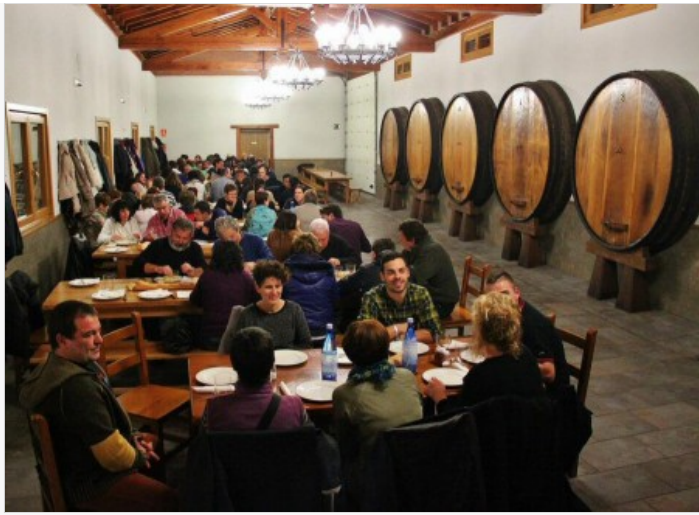
Txotx en la sidrería Aiorrenea de Astigarraga

El txotx es como se denomina la época durante la que en las sidrerías se prueba la nueva sidra, época que se inicia cada año el miércoles anterior a la semana de la fiesta de la Tamborrada de San Sebastián .