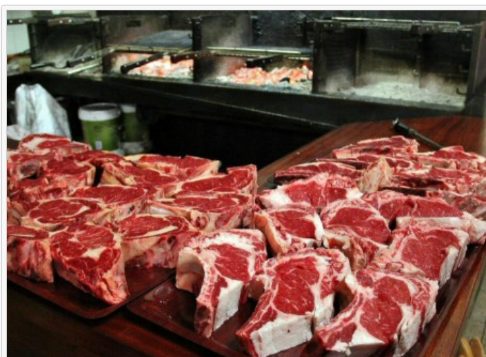
Chuletones para el txotx en la sidrería Aiorrenea de Astigarraga

En estas sidrerías tradicionalmente se habilita un espacio, en su mayoría con mesas altas, de forma que sin sentarte puedes probar la citada nueva sidra de la temporada.