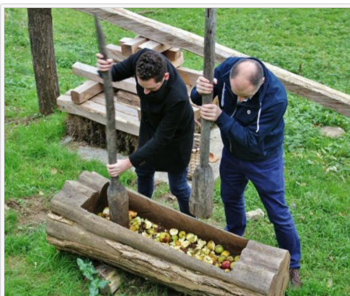
Visita del museo de la Sidra Vasca en Astigarraga

El denominado Territorio de la Sidra Vasca lo encuentras en Astigarraga , uno de los pueblos que rodean la ciudad de San Sebastián , donde se concentran la mayoría de las 51 sidrerías vascas que hay en Guipúzcoa, frente a 10 en Vizcaya y 2 en Alava.