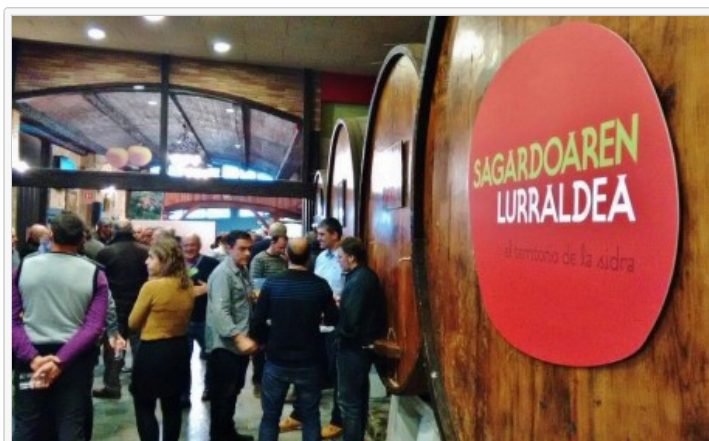
Txotx 2015 en sidrería Bereziartua de Astigarraga

Descubrí la sidra vasca ya hace muchos años, y desde entonces una botella tiene presencia asidua en mi mesa, de forma simultánea a la sidra natural asturiana.