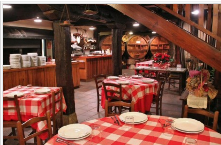
Restaurante-sidrería Roxario en Astigarraga