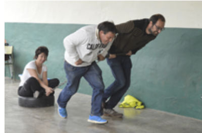
Osiñagako festak 2016