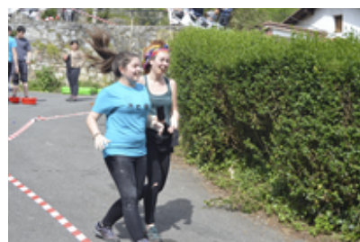
Gazte olinpiadak 2016