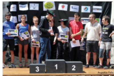
VI. Goizu Trail 2016