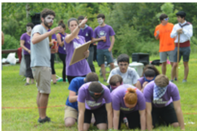
Gazte Olinpiadak 2016 ...