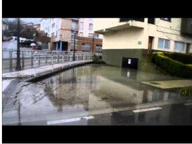
Uholdeak Urumea bazterretan