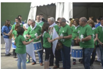
Mendekoste jaiak 2016