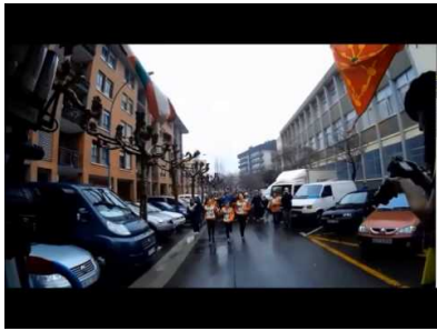
Korrika 19 - Hernani / Astigarraga