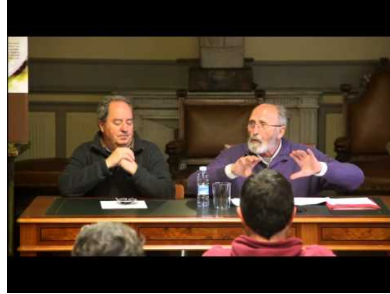
Hernanik 1000 urte