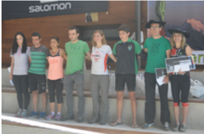
VI.Ereñotzuko Mendi La...