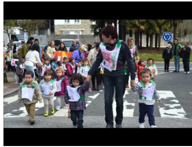
Korrika Txikia 2015