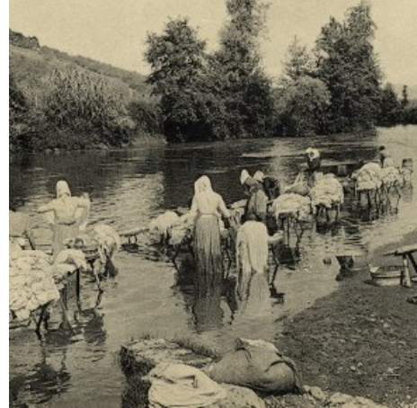
Garbiketa lanak egiten Urumea ibaian

Izen-emateak: 943550575 / info@sagardoarenlurraldea.com