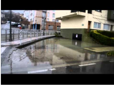
Uholdeak Urumea bazterretan