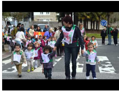
Korrika Txikia 2015