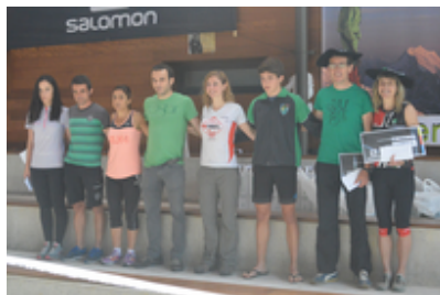
VI.Ereñotzuko Mendi La...