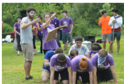
Gazte Olinpiadak 2016 ...