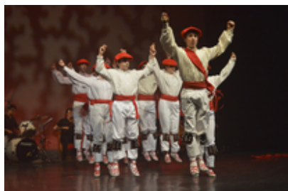
Ttarla dantza taldea 2016