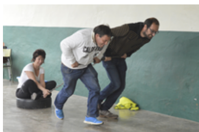
Osiñagako festak 2016