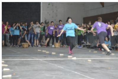
Gazte Olinpiadak 2016