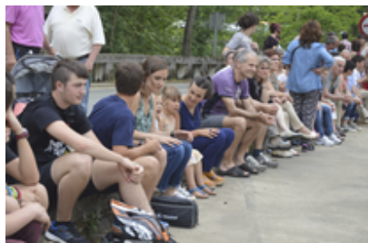
San Antonioak 2016