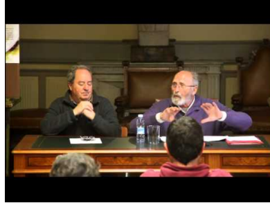
Hernanik 1000 urte