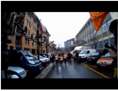
Korrika 19 - Hernani / Astigarraga