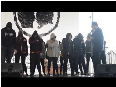
Hernaniko Gazte Olinpiadak 2016