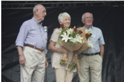
Ergobiko festak 2016