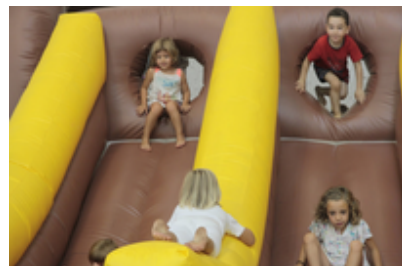
Goizuetako Fiestak 2016