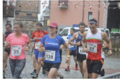
Ergobiko festak 2016