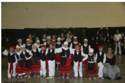
Goizuetako Fiestak 2016