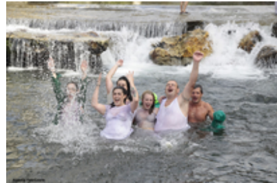
Goizuetako Fiestak 2016