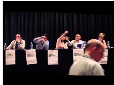
Mahai ingurua, alkategaiekin