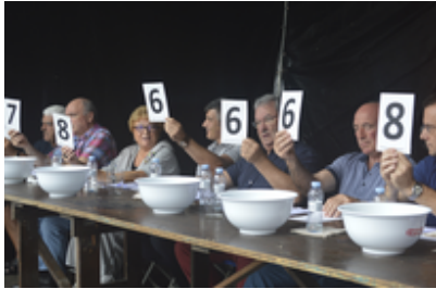
Ergobiko festak 2016