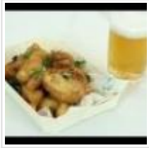
Recetas Exprés / Pollo frito guarripé