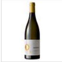
Acústic Blanc 2010