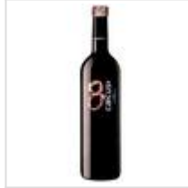
8 de Caecus