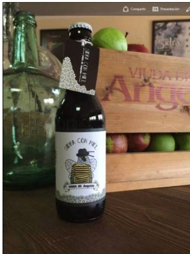
Sidra de miel

La Sidrería Viuda de Angelón lleva desde 1947 experimentando y recuperando técnicas casi desaparecidas al mismo tiempo que avanzan en la innovación de los derivados de manzana. Si hace 200 años era habitual la sidra de pera asturiana, se dejó en desuso por la fragilidad de los perales y la rentabilidad de los manzanales. Tras la entrada en el mercado de su sidra de pera acaban de presentar otra novedad para este año: la sidra con miel. "Lo que hacemos es una sidra natural 100% y le añadimos miel de nuestras propias colmenas , las que utilizamos para polinizar las