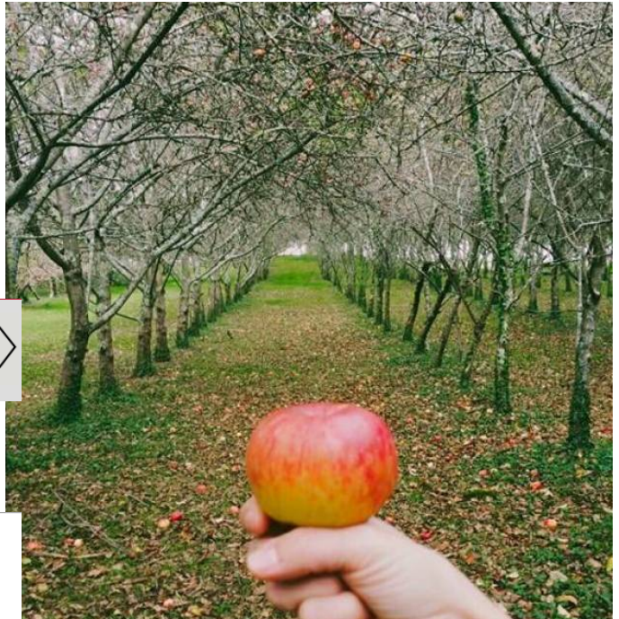
Una nueva visión de la sidra

Sidra es tradición, sí, pero también rabiosa modernidad: las hay afrutadas, para tomar con el aperitivo, en copa de vino sin escanciar, como postre y hasta para sustituir al champán. Tú eliges