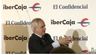
Foro Sector del Automóvil