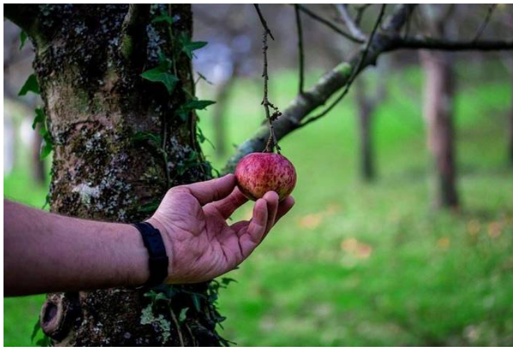
Estamos en temporada

Aunque el turismo de la sidra todavía está dando sus primeros pasos, muchos lagares empiezan a abrir sus puertas para dar a conocer siglos de tradición en las pomaradas y los perales que después de varias décadas en desuso han vuelto a dar cosechas. La novedad es que en los últimos años los sidreros no se conforman con producir sidra natural, sino que se abre paso a la experimentación y nuevas propuestas de una sidra para 'hipsters' que poco a poco se está poniendo de moda: sidras afrutadas, sidra para tomar con el aperitivo, en copa de vino sin escanciar, sidra para sustituir el champán, como postre... Estados Unidos y Gran Bretaña han descubierto este filón y son los mayores importadores de nuestra sidra contemporánea. Aquí dejamos algunas pistas para saber por dónde se moverá el mundo sidrero en los próximos meses.