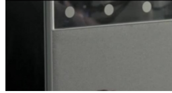
Yo, Daniel Blake - Trailer español (HD)