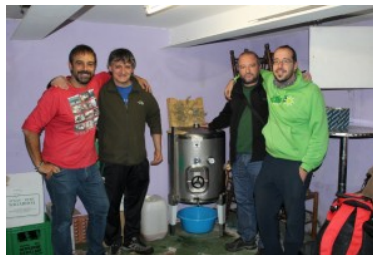
Andatz eta Txurizko sagardoaren egileak.