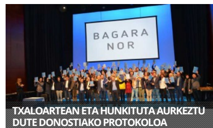
TXALOARTEAN ETA HUNKITUTA AURKEZTU DUTE DONOSTIAKO PROTOKOLOA