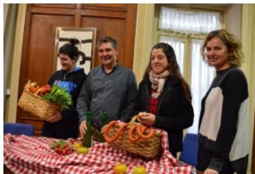
San Tomas eguneko egitaraua aurkeztu dute.