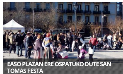
EASO PLAZAN ERE OSPATUKO DUTE SAN TOMAS FESTA