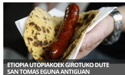
ETIOPIA UTOPIAKOEN GIROTUKO DUTE SAN TOMAS EGUNA ANTIGUAN