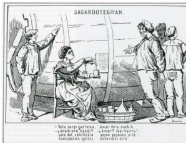
Irudia Donostiako La Galerna astekarian argitaratu zuten, 1890.

Urte batetik bestera errepikatzen den ohitura da, denboraren iluntasunean galtzen dena. Egun, hiritar askok eskualdeko sagardotegietara jotzen dute urteko sagardoa dastatzera. Duela gutxi arte, baina, sagardoaren eremuak ere Donostiako lurak hartzen zituen bete-betean, eta bizilagunek auzoetako sotoetan zuten aukera sagardoa edateko. Estimua handia zioten edariari, behar bada orain diotena baino handiagoa. Hala frogatu zuen, behintzat, Manuel Larramendi ikerlariak. Antza, 1828an, egunean, biztanleko hiru sagardo litro edaten ziren . Datu benetan ikaragarria.