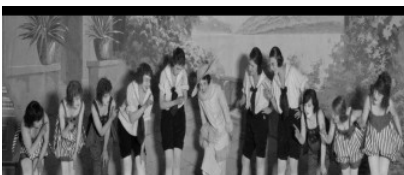
ANTZERKIAREN MUNDURA LEHEN ALDIZ GERTURATZEKO AUKERA ESKAINIKO DU EMAKUMEEN ETXEA