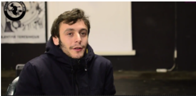
ZINEMALDI ALTERNATIBOA EGINGO DUTE LETAMAN GAZTETXEAN