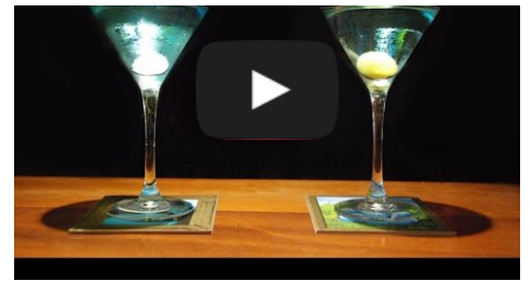
Visita nuestro Canal de YouTube

El menú de sidrería es el tradicional con una tortilla de bacalao (o bacalao frito acompañado de unos pimientos verdes). A continuación una chuleta asada en la parrilla (más de setenta vacas se van a consumir sólo en esta 'sagardotegi'. Para terminar el postre tradicional de queso, membrillo y nueces. Todo ello acompañado de la mejor sidra (o agua).