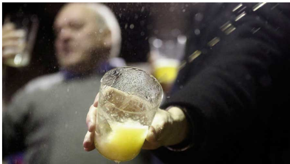
Un hombre llena su vaso de sidra en la celebración del 'txotx' en una de las sidrerías tradicionales.

TXOTX SIDRERIA NAVARRA CICLO COMPLETO SIDRA