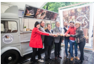
Donostiatik aterako da Cider Truck ibiltaria.

Maiatzaren 18an Donostian hasiko du ibilaldia eta ondoren sei hilabetez nazioartean zehar ibiliko da Cider Truck ibilgailua.