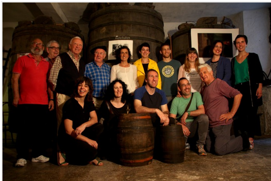
Txaparro sagardotegian izan da aurkezpena. | Ikusi handiago | Argazki originala

Sagardofest egitasmoak estreinakoz hartuko du Tolosa; ekainaren 9tik 11ra bitarte, sagardoaren kulturaz blaituko dute egitaraua