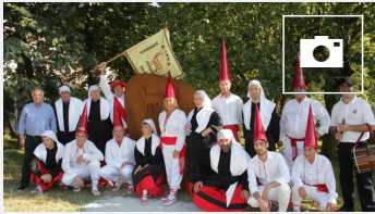
Fiestas del barrio de Oria