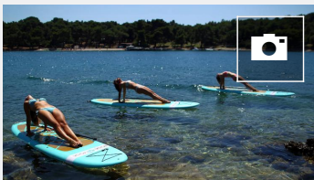
Las mejores imágenes del día - 11/07/17