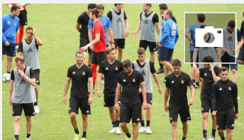
Entrenamiento de la Real