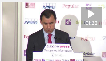
Maillo ve una "bajeza política" no homenajear a M. Á. Blanco