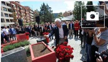
Homenaje en Ermua a Miguel Ángel Blanco