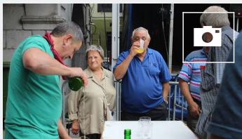
📷 Alegiako festak, iruditán