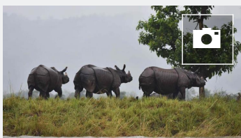
📷 Temor al aumento de la cacería furtiva tras las inundaciones en India