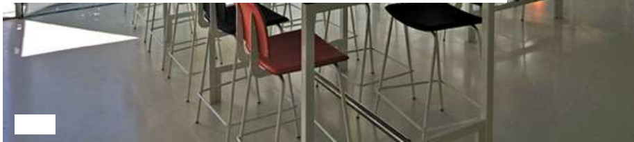
Museo San Telmo