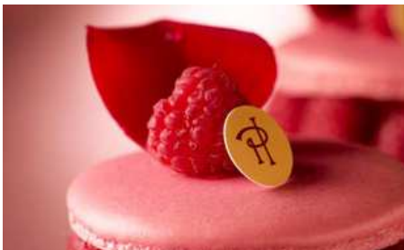
POR QUÉ NOS GUSTAN TANTO LOS MACARON