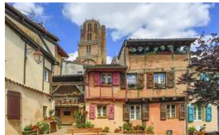
10 COSAS QUE SE APRENDEN EN EL TARN FRANCÉS