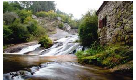
EL ONCE CANALLA: PLANES ANTI-LLUVIA