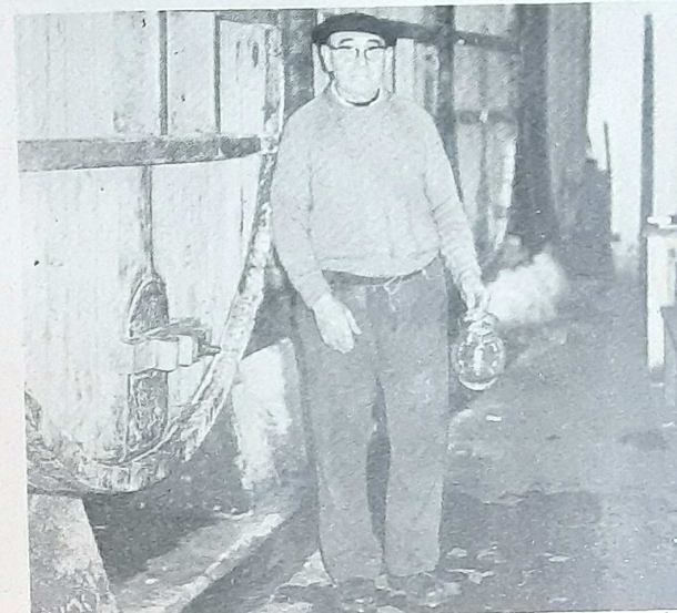
Las "kupelas" son algo sagrado. En enero es cuando los compradores acuden a probar el líquido, "al txotx" (espita)