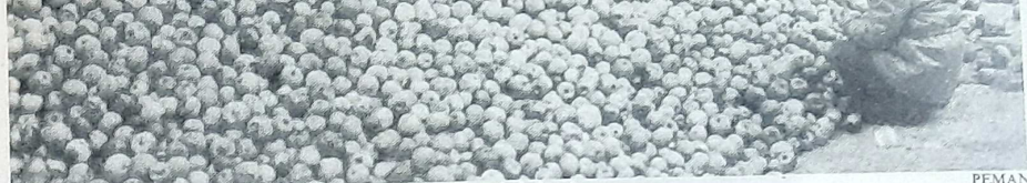
Es necesario guardar la debida proporción de diversas variedades de manzana