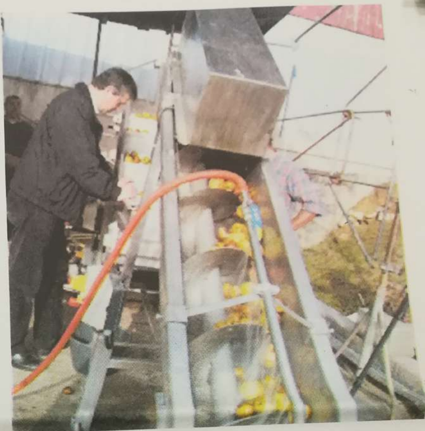
Proceso de lavado de las manzanas, antes de afrontar el prensado.