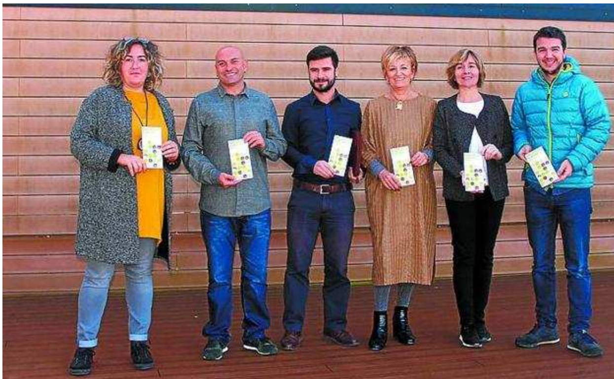
Los organizadores, durante la presentación del evento

Estas segundas jornadas sobre la sidra se desarrollarán los días 23, 24 y 25 de este mes, con la presencia de 21 ponentes nacionales e internacionales en torno a tres ejes fundamentales: la manzana, la sidra y las sidrerías como recurso turístico. Además de ello, el día 25 se celebrará el primer Sagardo Forum Concurso Internacional de Sidra, al que ya se han inscrito 115 sidras provenientes de 11 países distintos.