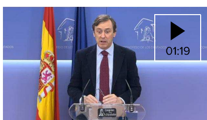
▶ Rafa Hernando le pide a Rivera "más respeto al PP y menos mentiras"