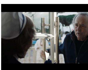
▶ 'Amodio', el nuevo anuncio de Campofr

© Sociedad Vascongada de Publicaciones, S.A. Domicilio social en Camino de Portuete, 2 San Sebastián 20018