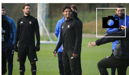
📷 Último entrenamiento de Vela en Zubieta