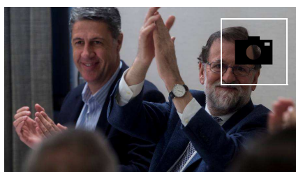
📷 El cierre de la campaña electoral en Cataluña, en imágenes