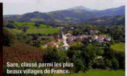
Sare, classé parmi les plus beaux villages de France.