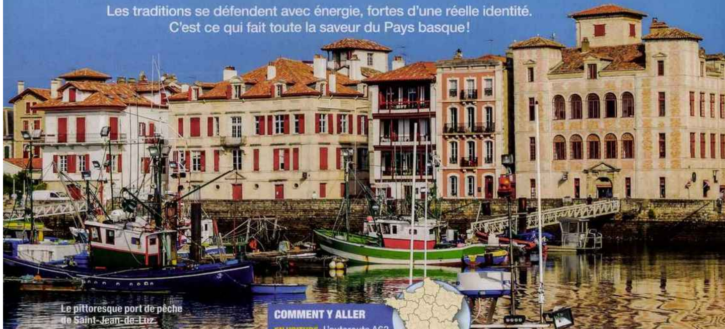
Le pittoresque port de pêche de Saint-Jean-de-Luz

Les traditions se défendent avec énergie, fortes d'une réelle identité. C'est ce qui fait toute la saveur du Pays basque!