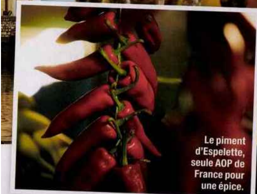
Le piment d'Espelette, seule AOP de France pour une épice.