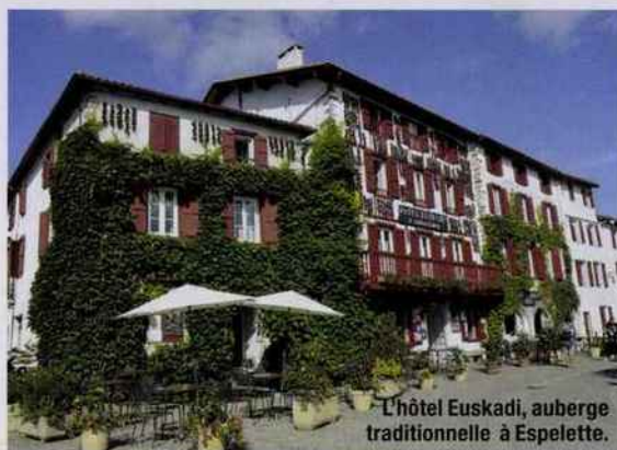
L'hôtel Euskadi, auberge traditionnelle à Espelette.

Ancien relais de la Poste de Saint-Jean-de-Luz, au XVIIIe siècle, le bâtiment est aujourd'hui un hôtel de caractère à la décoration « néo basque » qui compte 34 chambres, dont 6 avec terrasse et vue sur l'océan. Le tout en plein cœur de la cité. À partir de 69 €/nuit. Tél. : 05 59 26 04 53 grandhoteldelaposte.com