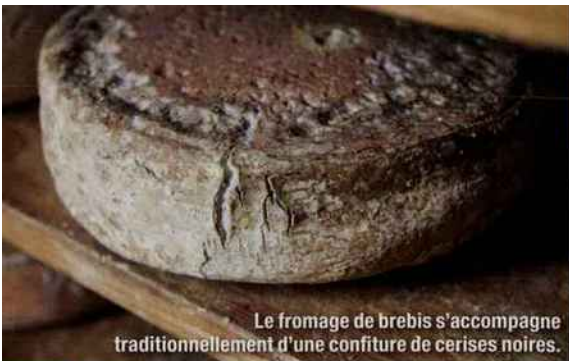
Le fromage de brebis s'accompagne traditionnellement d'une confiture de cerises noires.