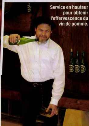
Service en hauteur pour obtenir l'effervescence du vin de pomme.

sablée, il y a un ordre d'intégration des ingrédients très important. » Et de scander : « BSOF : beurre, sucre, œufs et farine (type 55) ! On les travaille à température ambiante en prenant soin de bien intégrer chaque ingrédient avant d'incorporer le suivant : pas avant ! » Crème pâtissière ou confiture de cerises pour fourrer le gâteau ? C'est à vous de choisir ! « Mais pour avoir le croustillant et le moelleux du gâteau basque, il faut mettre 2/3 de pâte pour 1/3 de crème. Si l'on choisit la confiture, il faut appliquer juste une fine pellicule pour rester sur le biscuit, pas plus de 100/120 g pour un gâteau de 6 personnes. »