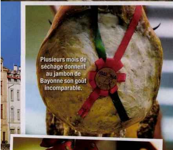
Plusieurs mois de séchage donnent au jambon de Bayonne son goût incomparable.