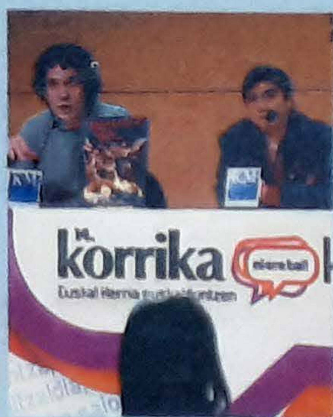
Juan Carlos RUIZ | ARGAZKI PRESS

Korrika Kulturala arrancará el día 22 en Bilbo