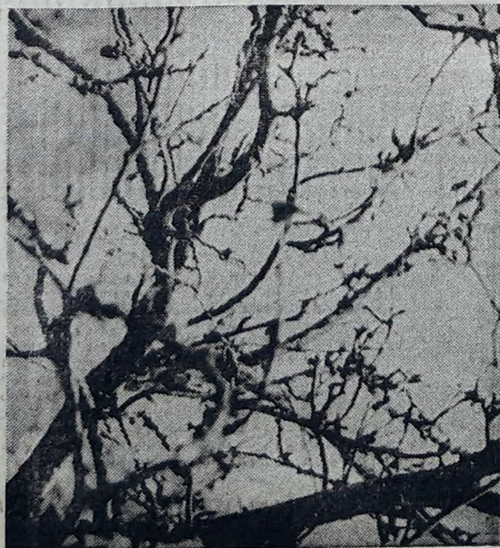
Muchos manzanos están enfermos y hay que renovarlos

Las ayudas serán solicitadas por el propio campesino interesado a través de las oficinas comarcales de Extensión Agraria de la Consejería de Agricultura y Pesca mediante una instancia. La certificación que acredite la afiliación del solicitante a la Seguridad Social Agraria y una memoria explicativa de la mejora a realizar y presupuesto desglosado por partidas.