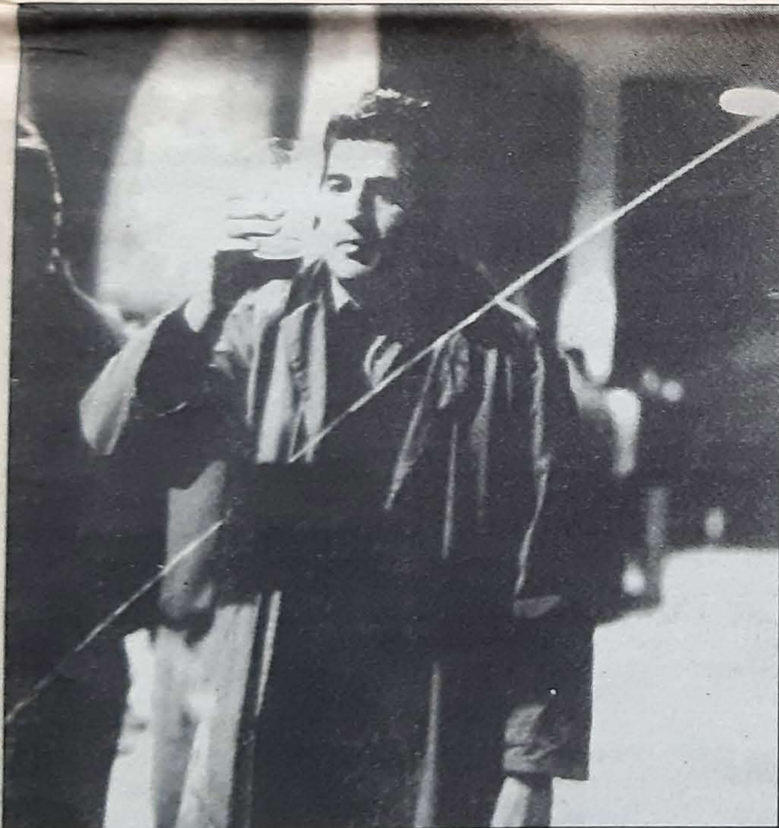
El último trago

¡Que recuerdos, tío!. Ni resaca tengo. Más bien ganas de repetir.