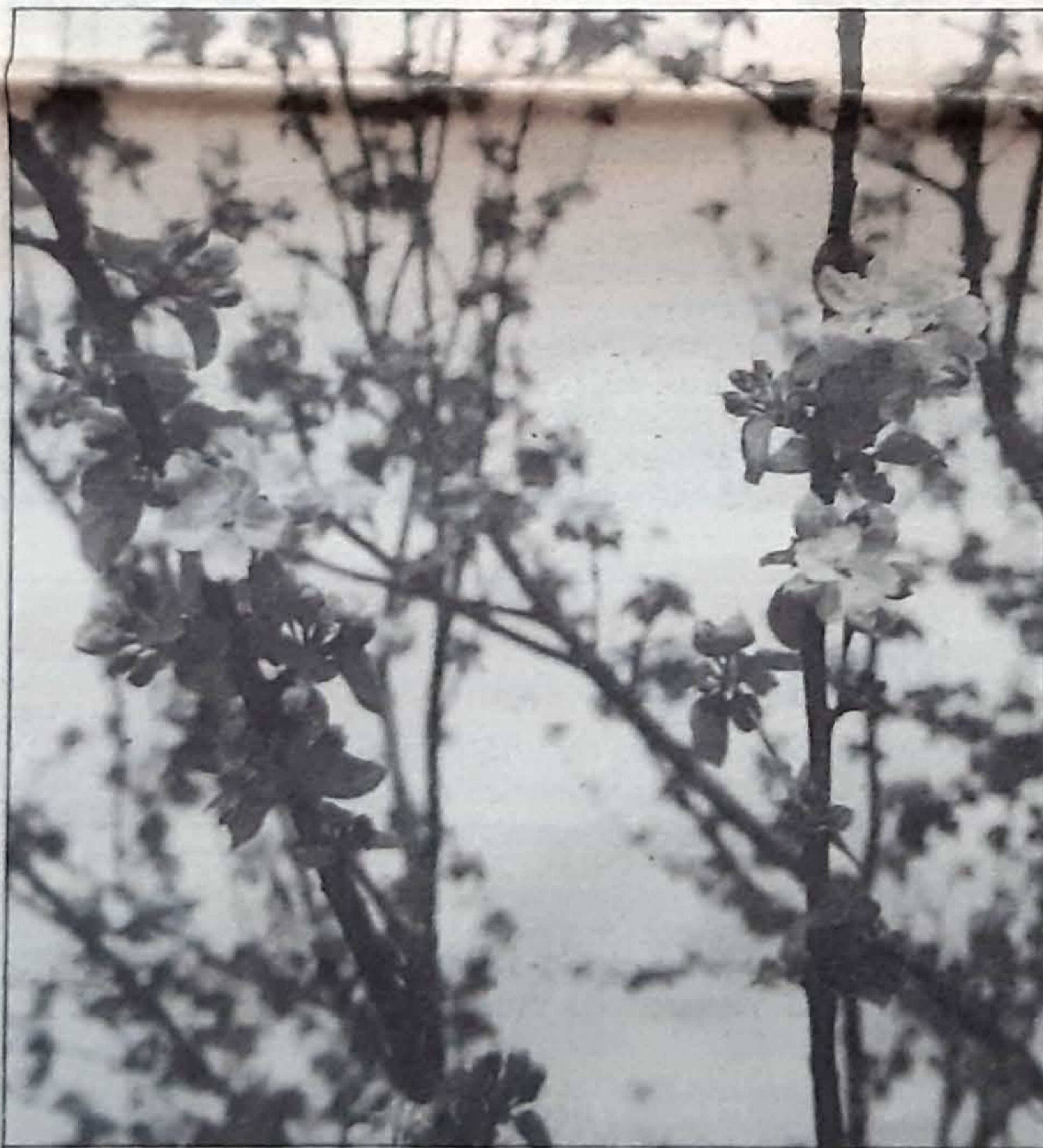
París subvenciona las plantaciones de manzanos

La calidad de la sidra natural elaborada en el Estado francés se puede considerar buena, especialmente la de Bretaña y Normandía. También es buena la de Gran Bretaña (Inglaterra), Irlanda y Alemania (Renania). Y de peor calidad la de Suiza, Austria, Canadá y EE.UU. Así opina el especialista tolosarra José Uria.