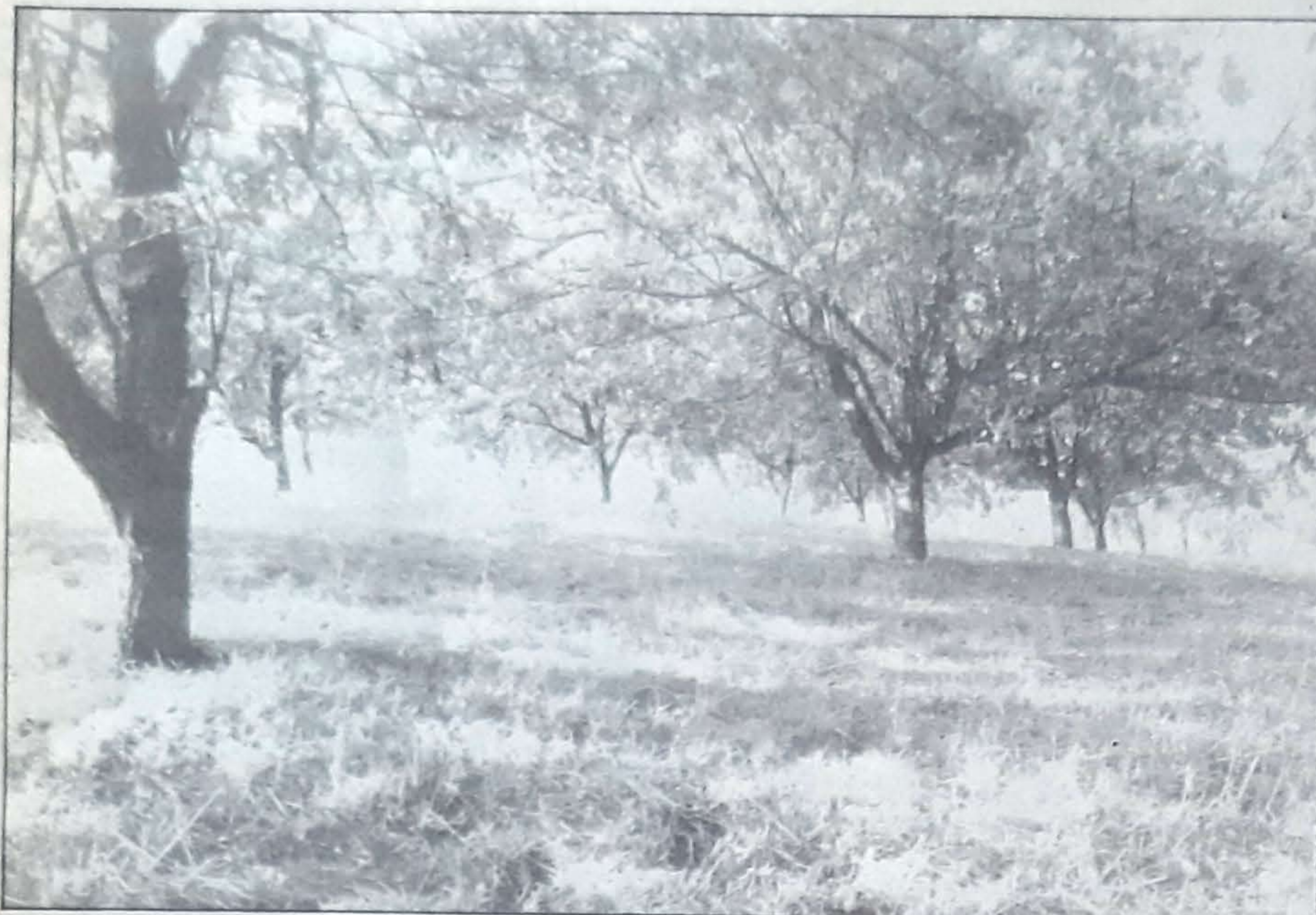
Normandia y Bretaña eran hasta hace poco las reservas de manzana sidrera en Europa