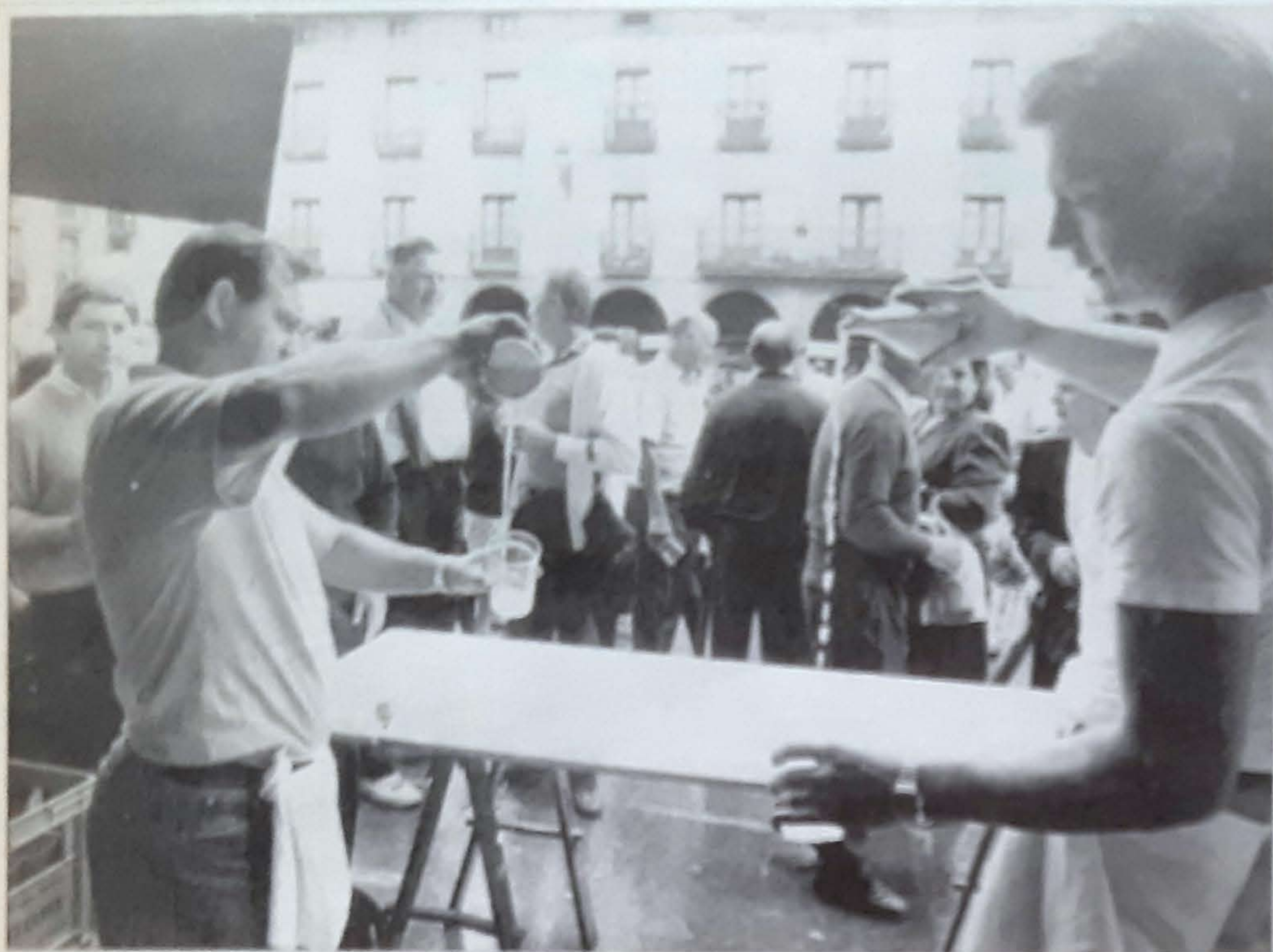
Un total de 14 sidrerías participaron en el concurso organizado por la sociedad Sallobente

La sidrería Urdaira de Aginaga venció en el concurso de sidra