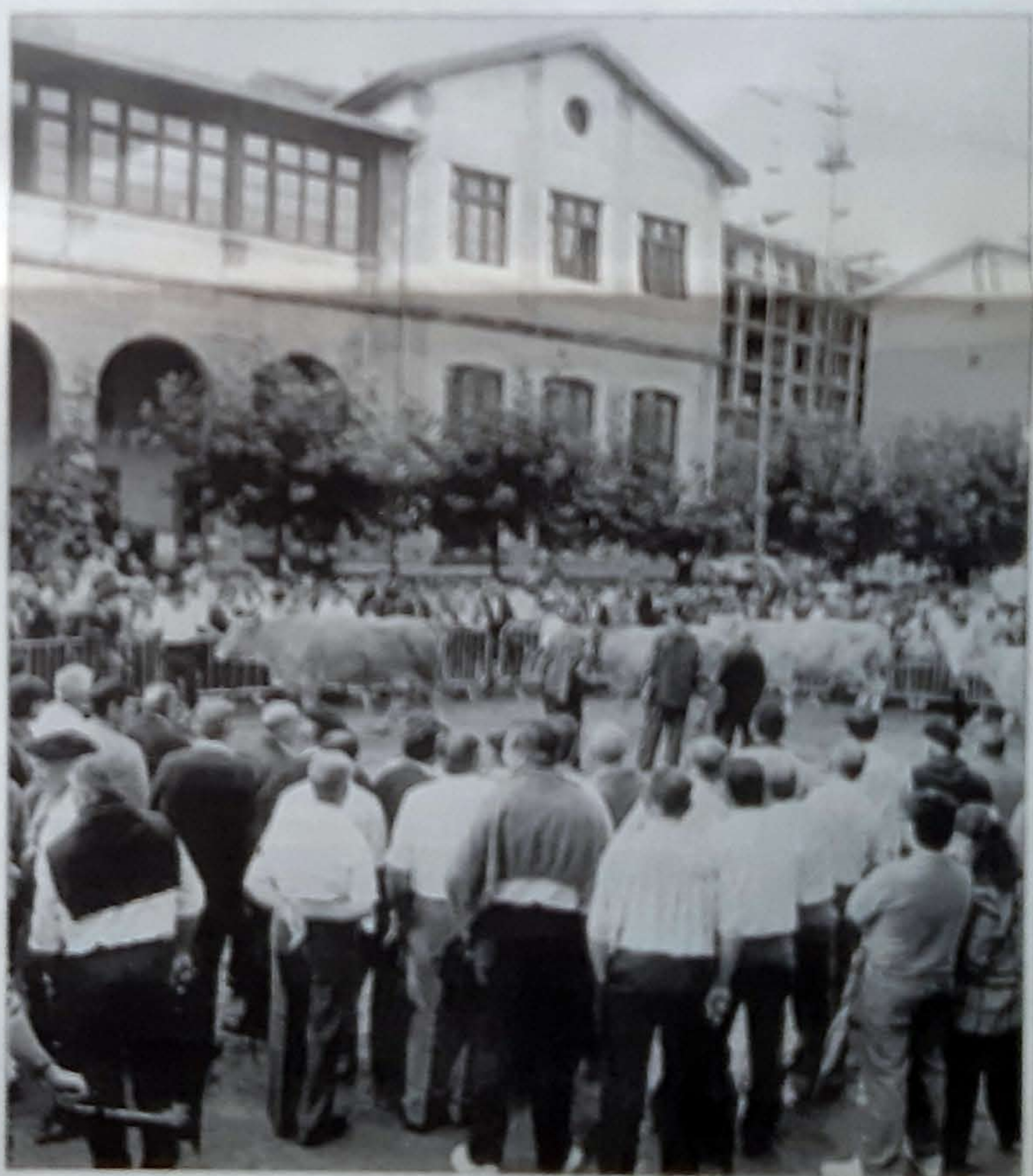
El concurso de ganado reunió a gran cantidad de compradores y curiosos

A las 6.30 se celebró la prueba final de deportes rurales entre los equipos de Mutriku, Mendaro, Elbar y Elgoibar, para a las 7.30 la orquesta Gelatxo siguiera con la romería. El punto y seguido de la fiesta lo puso la «Txatanuga Futz Band».