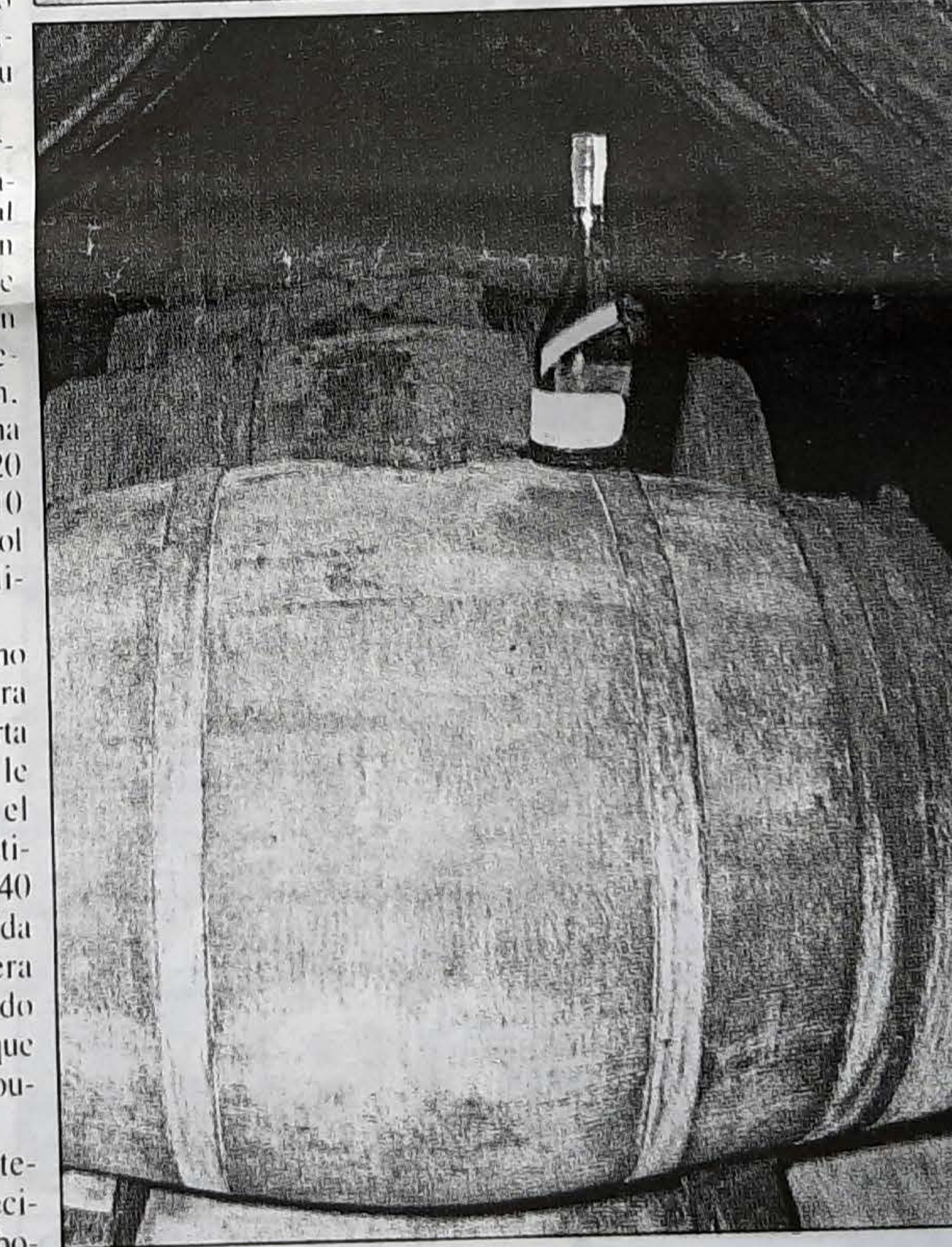
Tras la destilación en el alambique, el líquido reposa durante varios años en una barrica de roble.