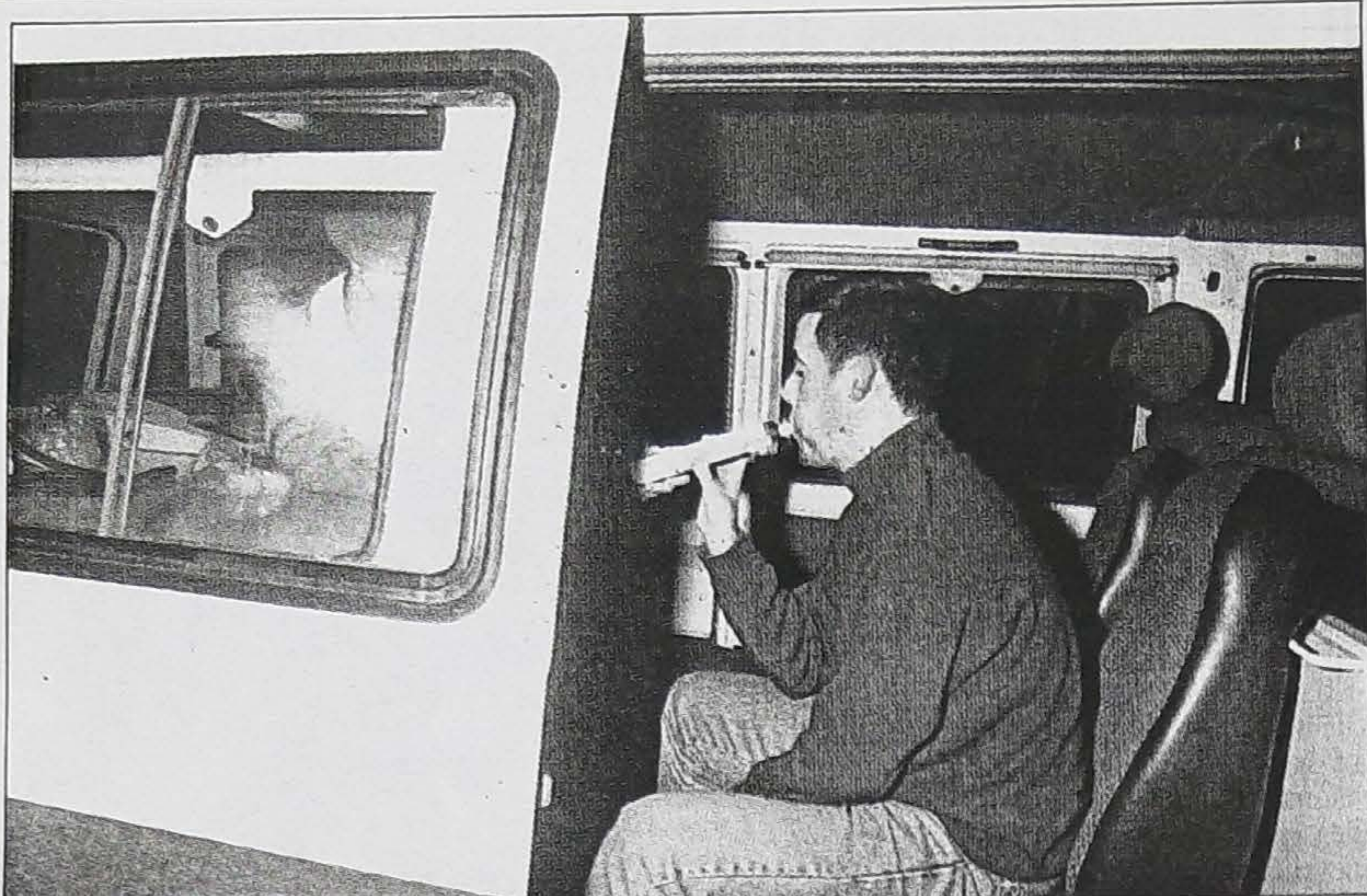
A partir de cierta hora es muy normal que de positivo.