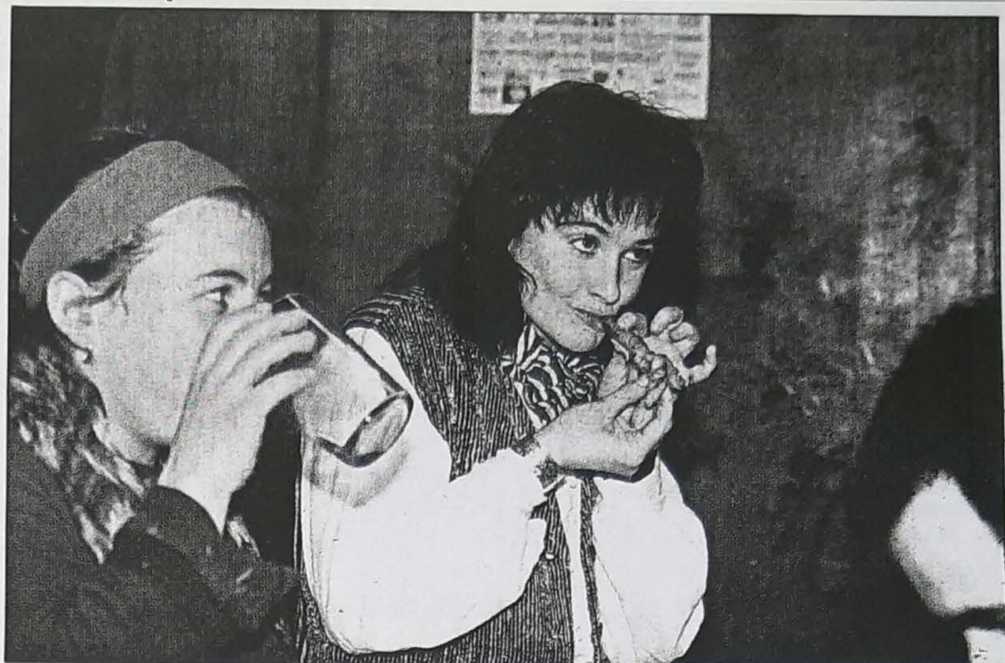
Ez dago ez taberna ez jatetxeekin konparaterik.