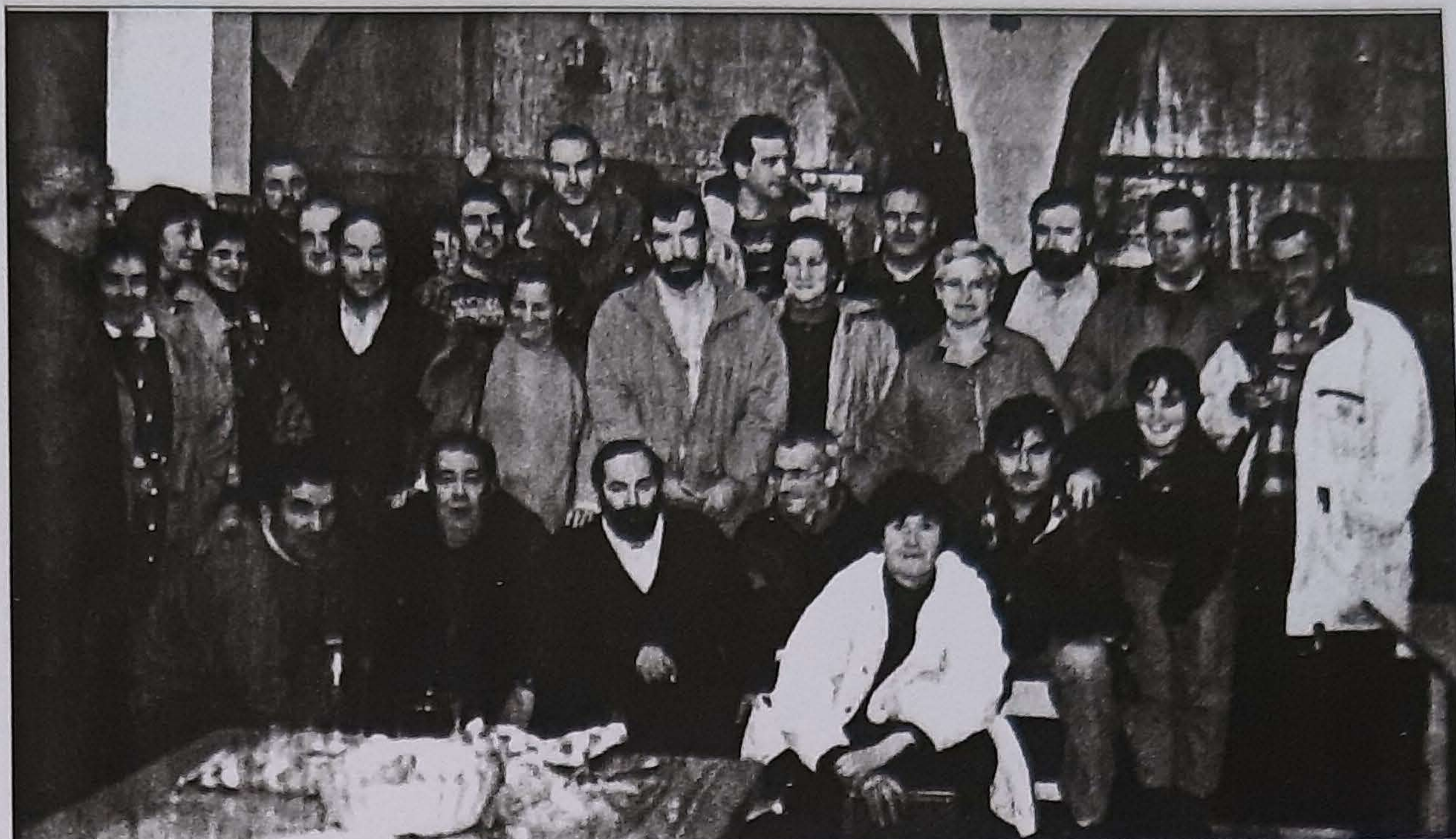
En la foto, todos los asistentes al cursillo en una sidrería.

A Domingo le gustaría que las nociones impartidas cuajaran y se manifestaran en proyectos de elaboración concretos. "Lo que se trata es de adaptar las instalaciones a sus necesidades. Se pueden elabo-