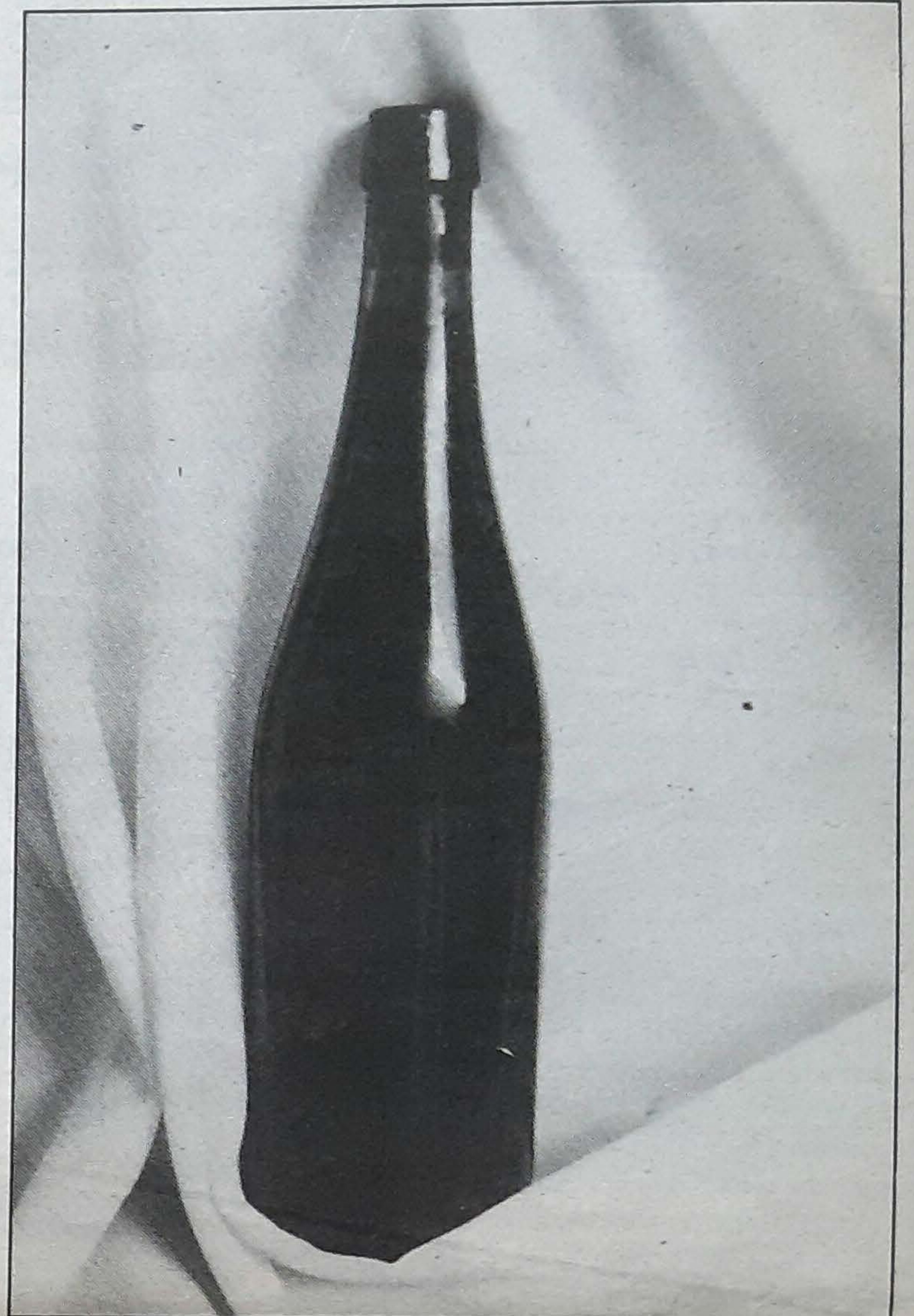
Baliteke datorren urtean edo hurrengoan lortzea labela. ANDER GILLENIA

■ Labela sagardogileek lortu nahi duten ezaugarri preziatua da, sagardoari merkatua zabaltzen eta kalitateko produktua egiten lagunduko lukeela uste baitute. Horretarako urratsak hasi dituzte han eta hemen, baina traba batzuk gainditu behar dira; hala nola, sagarraren erdia gutxienez bertakoa izatea, lia edo ama kentzea eta edaria ez oliotzea. ■