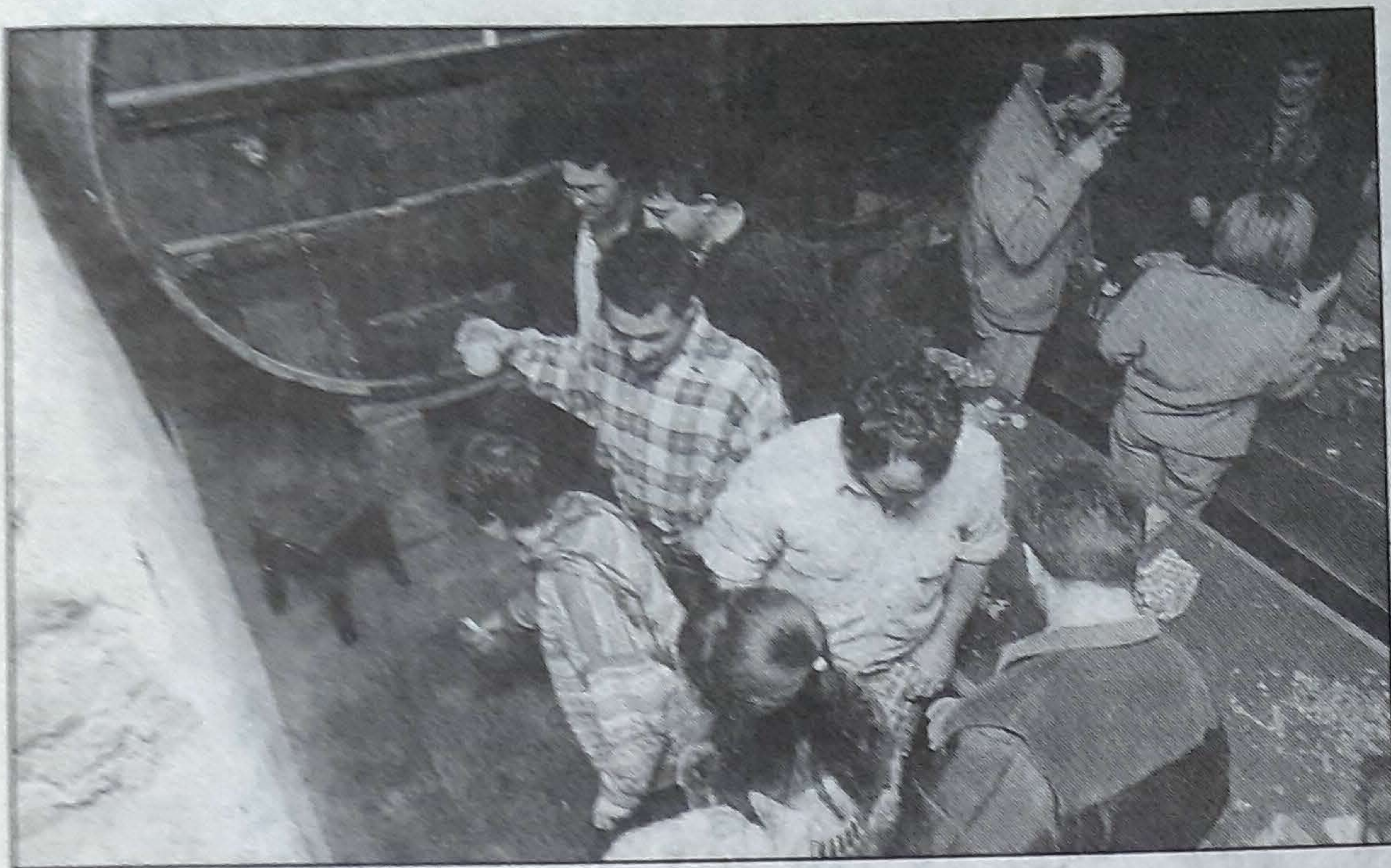
Txotx garaian gero eta jende gehiago hurbiltzen da sagardo upelak dituzten jatetxeetara.