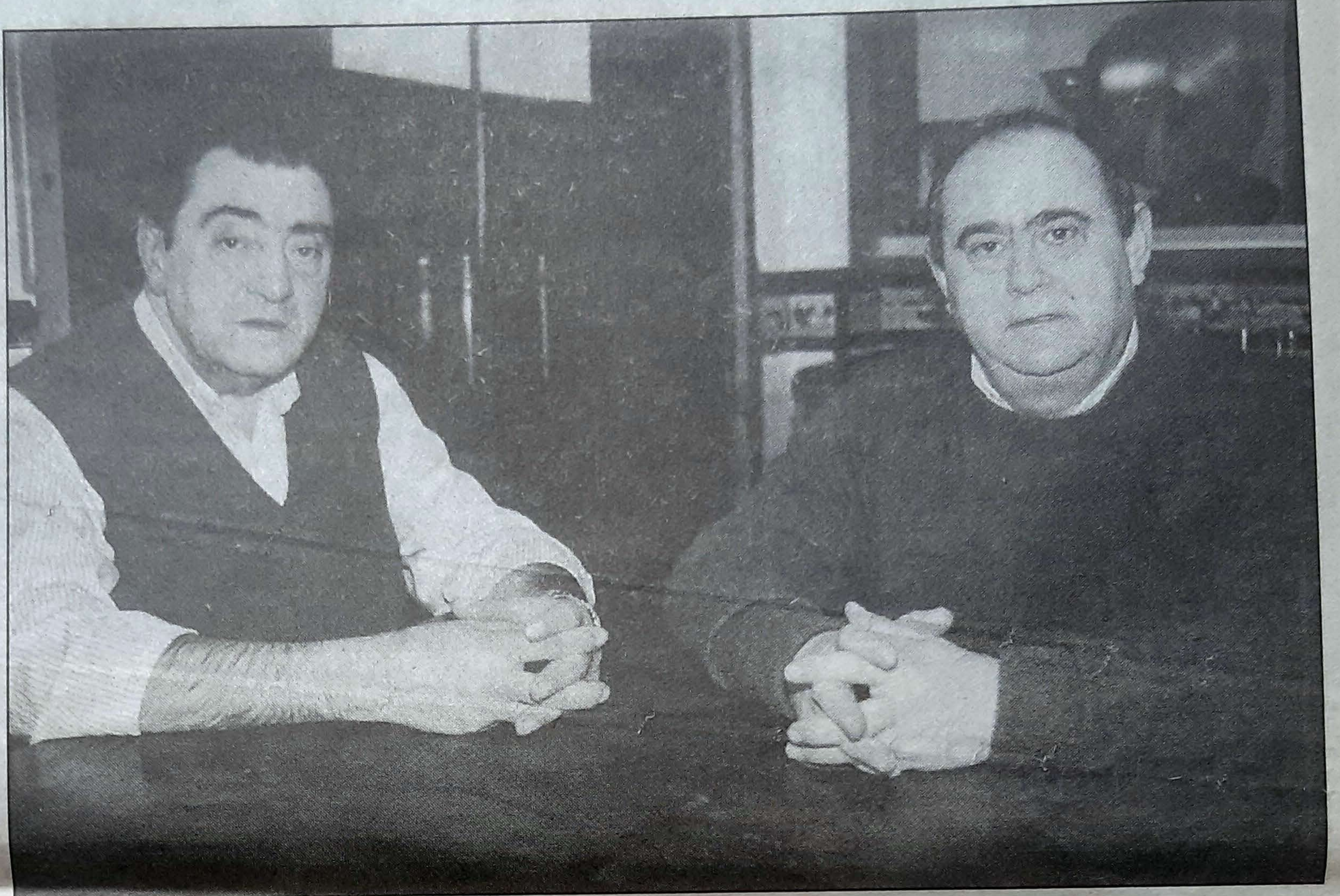
«Batzuk sagardotegira beste zerbait edanda etortzen dira...» ANDER GILLENEA

Espolosin: Hori... Hori beraiek dakite. Beraiek hori esaten dute,