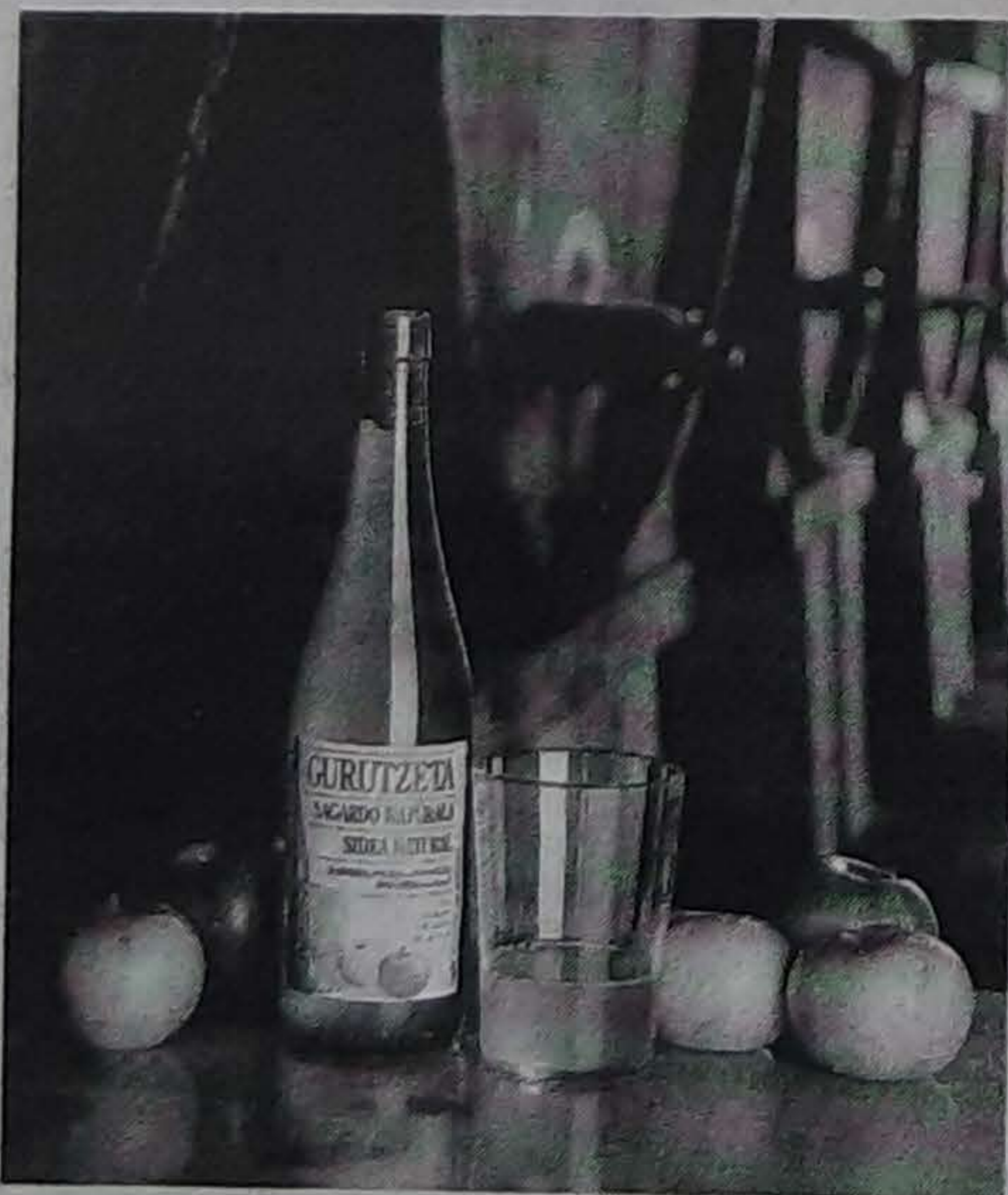
Sagardo Natural Orekatua, lasto kolore eta fruitu zaporezkoa, edozein jakirentzat egokia.

SAGARDOAN JAKITUNA BAZARA ALDEA NABARITUKO DUZU