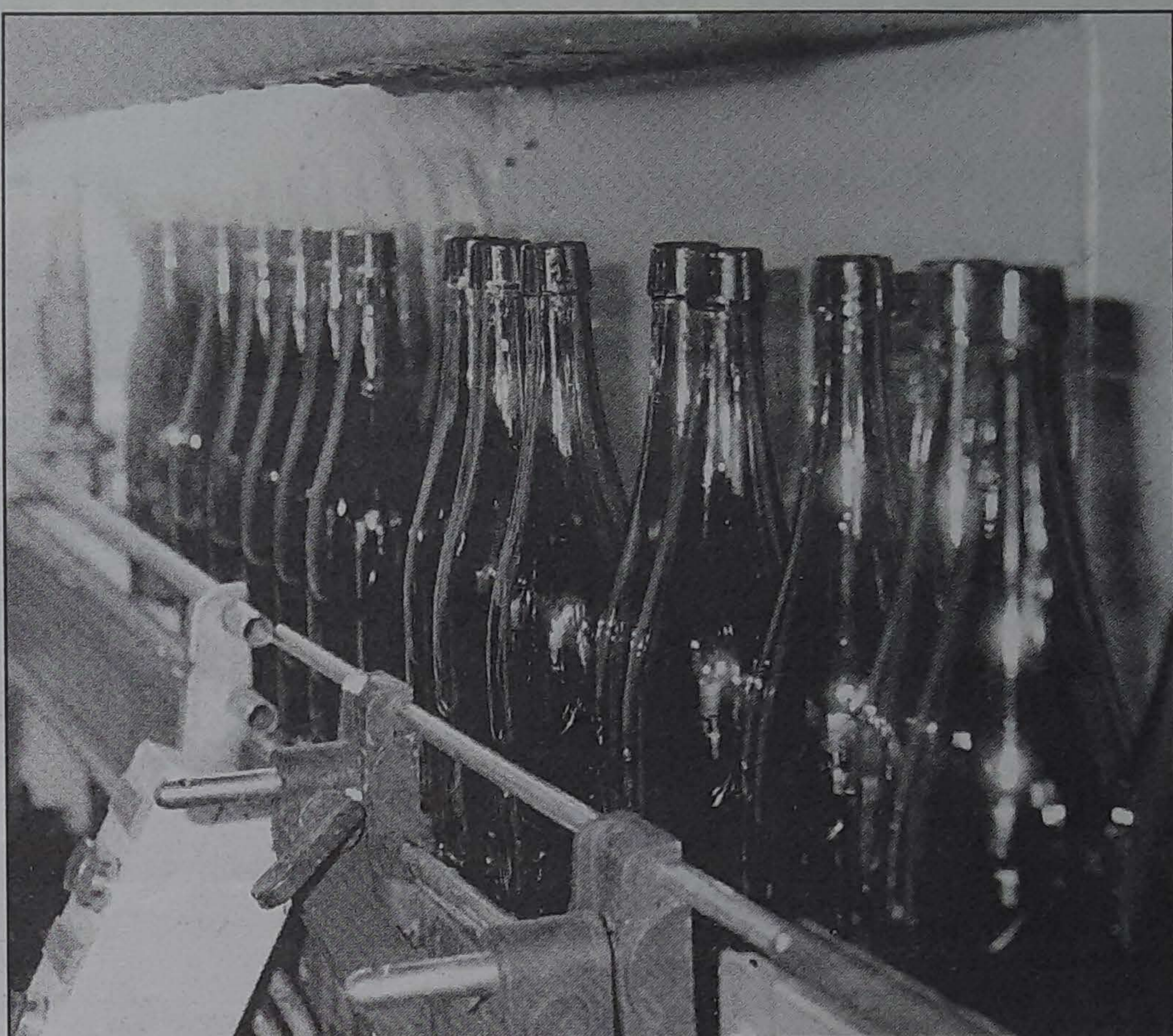
Lehen txanpain botilak erabiltzen zituzten sagardoa botilaratzeko. Egun, ordea, debekatua dute.

Salmenta prozesua ere bestelakoa zen garai batean. Aginagaren hitzetan, «lehenago sagardo guztia etxetik saltzen genuen. Horrela upel bakoitza zein egunetan botilaratu behar zen ikusi behar zen. Eta egun horietan etortzen ziren bezeroak beren botila hutsekin eta ekartzen zituzten beren botilak garbituta. Haiek ekarritako botilak betetzen ziren». Gaur egun ere sagardotegietara joaten den jendeari zuzenean saltzen diote sagardoa, baina