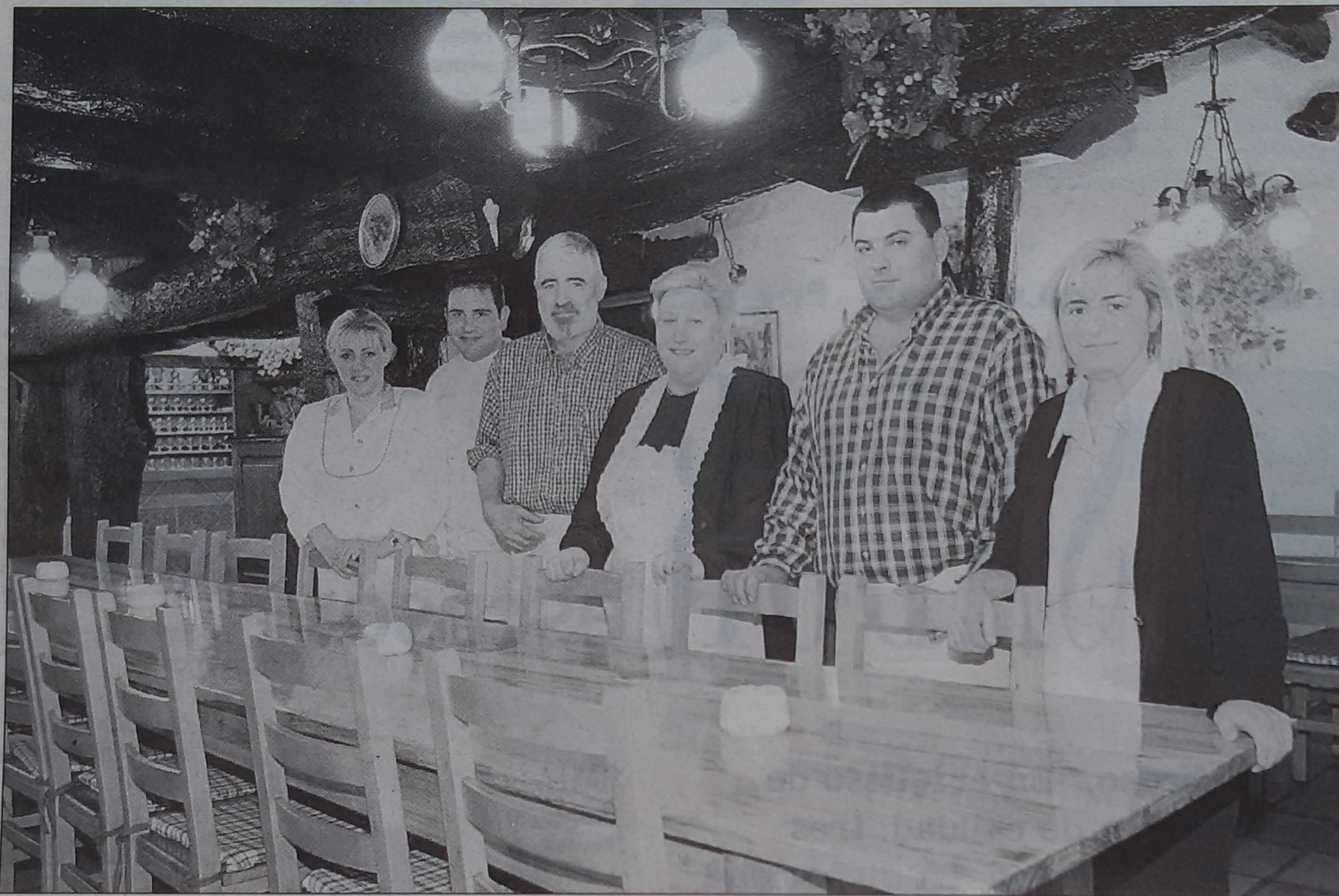
Todos los responsables del Saizar, en el interior de la sidrería.