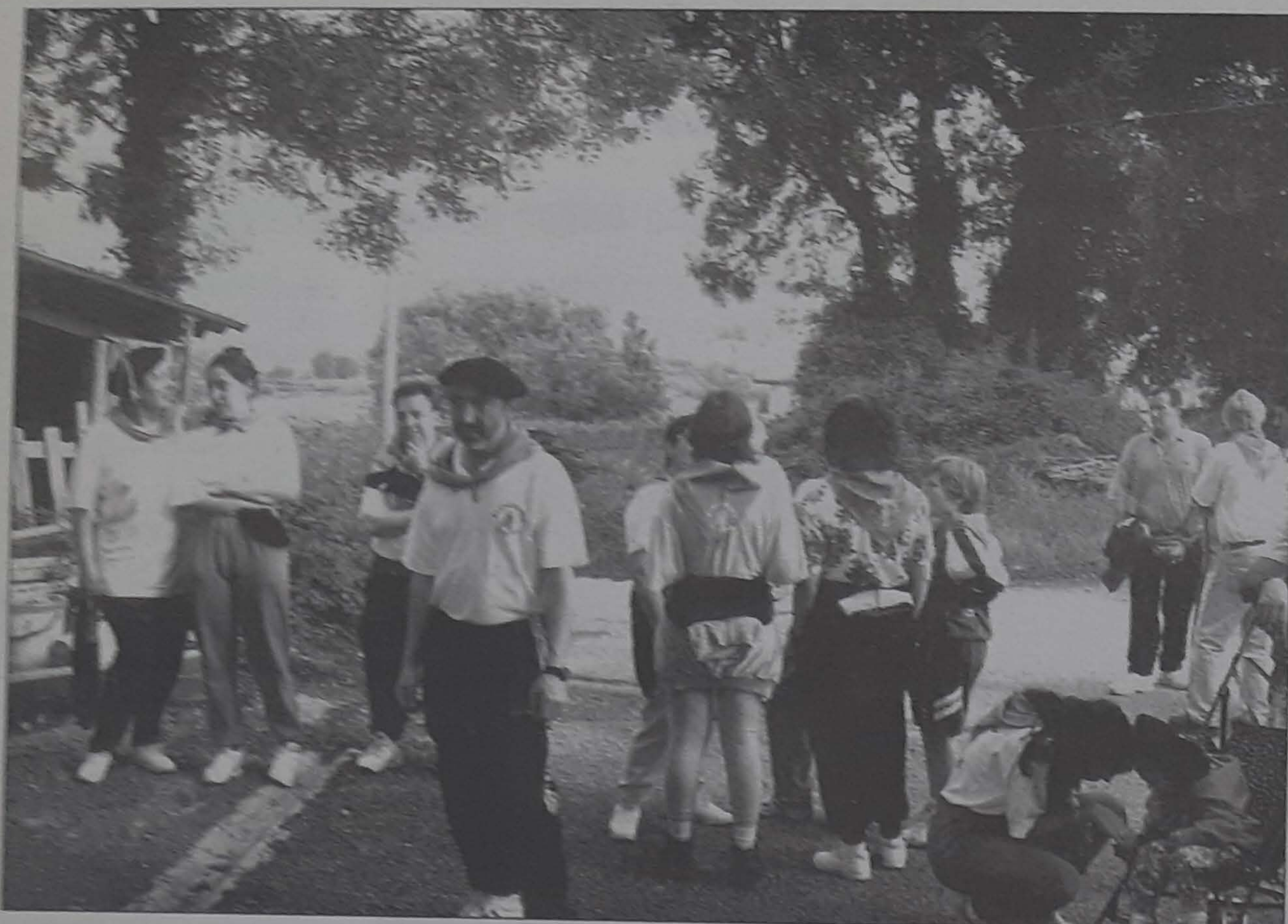
Los Sanmarciales comenzaron el 18 de junio, con el tradicional reparto del programa festivo por los caseríos de Altza