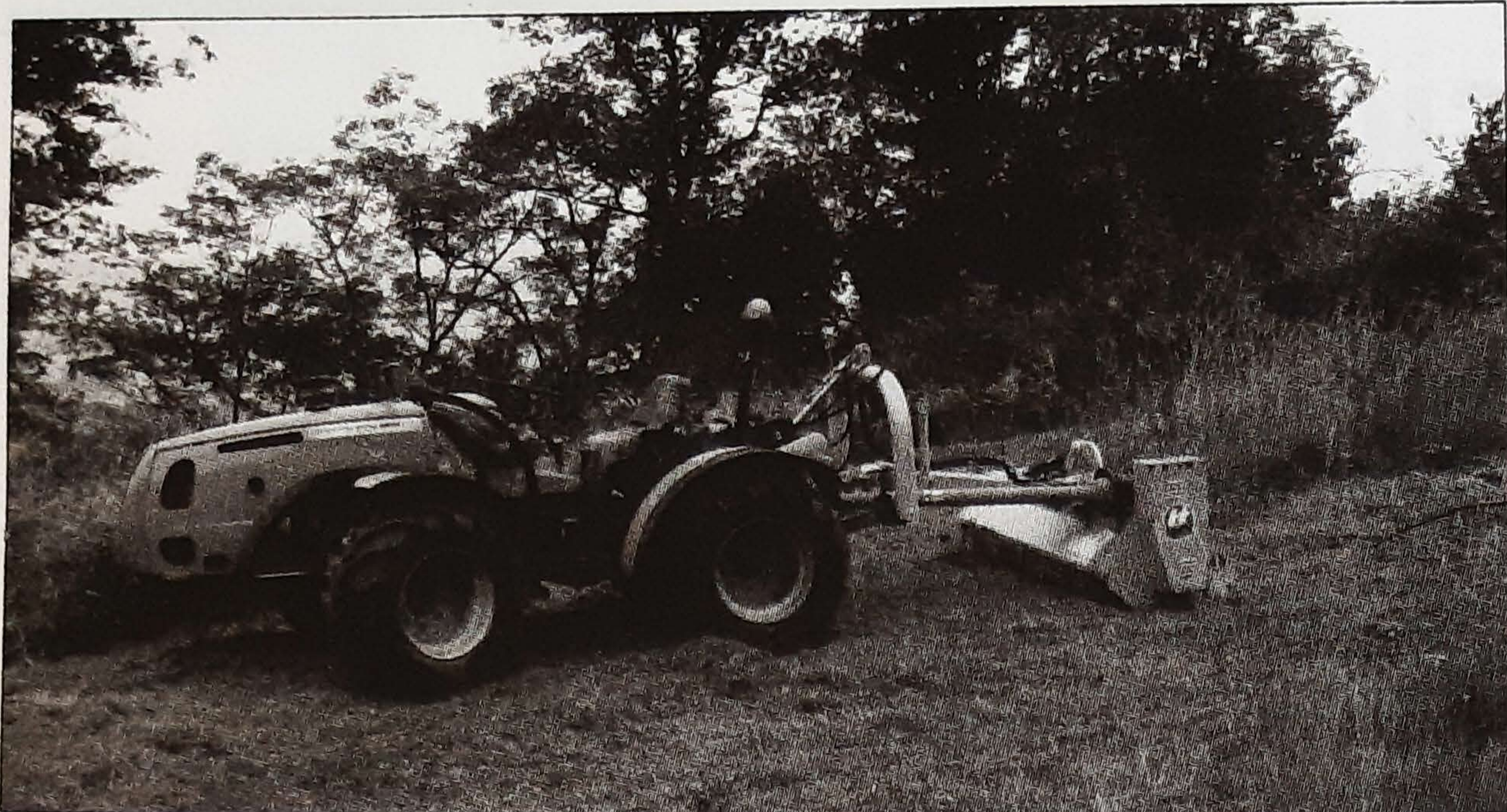
Behemendi Elkarteak sasitza kentzeko erosi zuen makina.