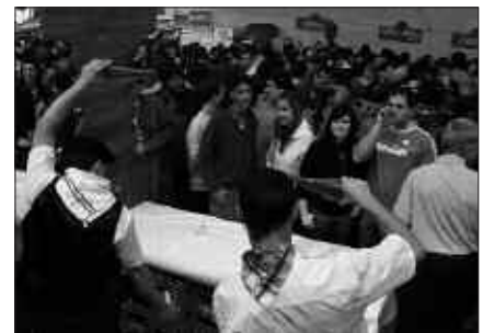
SAGARDO EGARRIZ ZEGOEN JENDEA. NAHIZ ETA AURTEN LAGUN GUTXIAGO IBILI, BOTATZAILEAK ETENIK GABE ARITU ZIREN LANEAN.