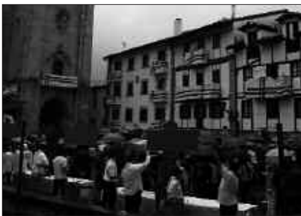
BOTATZAILEAK DAUDEN TOKIAN BETI IZANGO DA SAGARDOA EDATEKO PREST DAGOENIK. EURIA GOGOTIK EGIN ARREN...