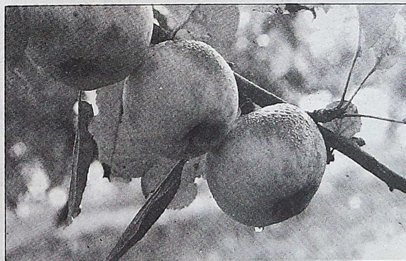
La manzana da un gusto especial a los platos.