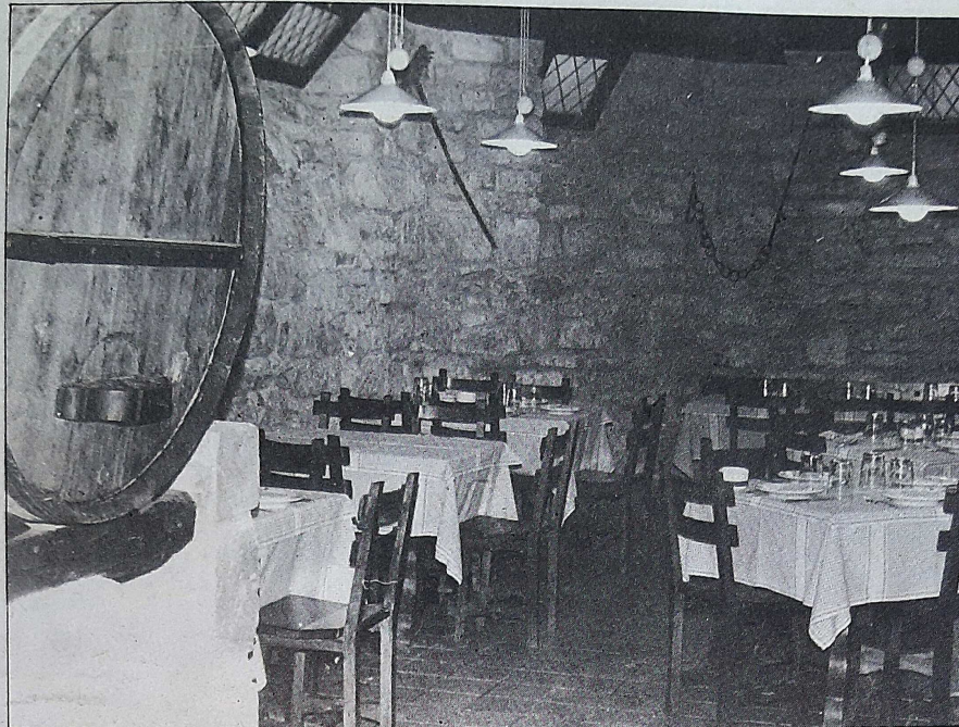
Ahora, se utiliza más la manzana en la cocina.

Asimismo, las ensaladas están evolucionando hacia cotas que hace algún tiempo serían insospechadas. Ahora, están tomando un cariz especial ensaladas con una salsa rosa