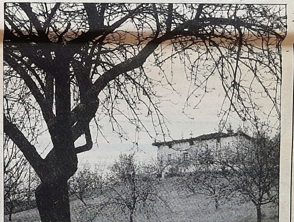
Sagarondoaren kopurua txikia da.