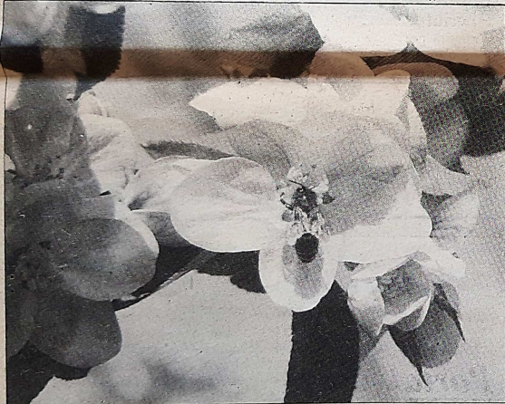
Lore hauetatik sagarra hazitzen da.

Azkenik, une latzak eta onak igaro ondoren, baserriar honen asmoa bere lanean segitzea da, ingurugiro hori guztatzen baitaio. Eta, tonu txorigaldu eta alai batez adioa ematen digu, «sagarrekin lanean aritzea baino, ederragoa edaten aritzea da». Bai, motel!