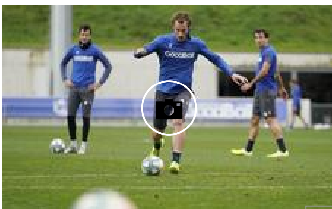
La Real Sociedad prepara el derbi ante el Eibar