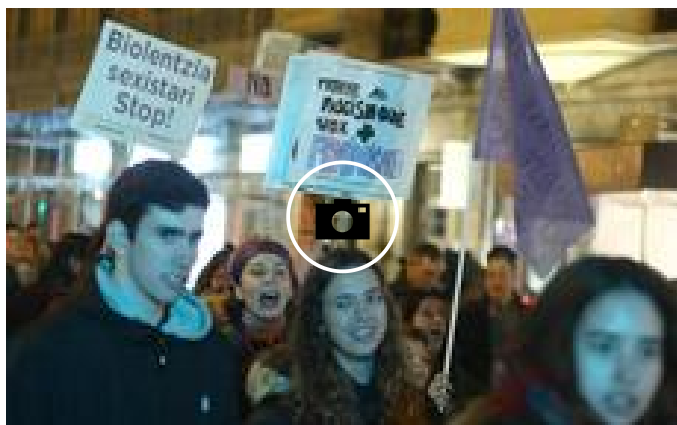
Un millar de personas se manifiesta en Donostia