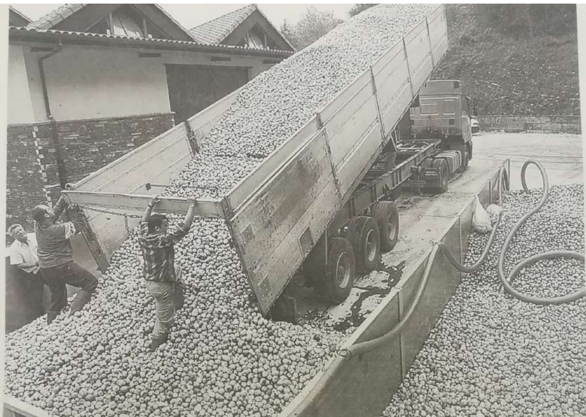
Un camión con manzana de la zona de Sarriá (Lugo), descargando en la sidrería Herrero de Astigarraga.