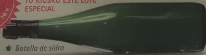
Botella de sidra

A PARTIR DEL PRÓXIMO DOMINGO PODRÁS ADQUIRIR EN TU KIOSKO ESTE LOTE ESPECIAL