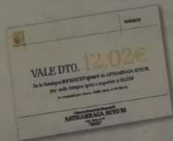
Vale de 12,02€ canjeable en la Boutique Renault