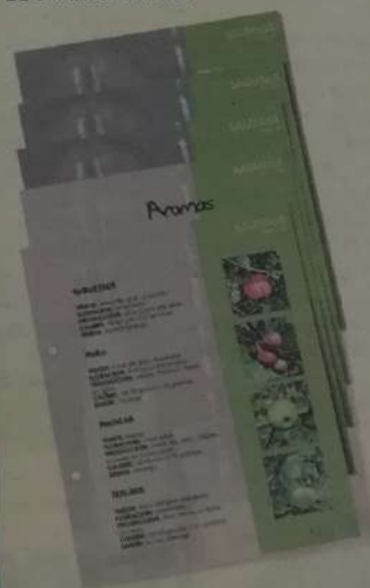
Estas son las 5 fichas de la primera semana

Cada semana de lunes a viernes conseguirás 5 fichas de esta magnífica colección que te ofrece GRATIS en exclusiva tu periódico: EL DIARIO VASCO