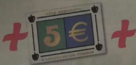
Vale de 5€ canjeable en las sidrerías