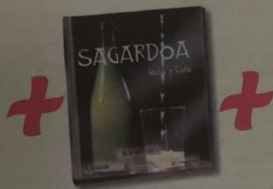
Archivador de la colección