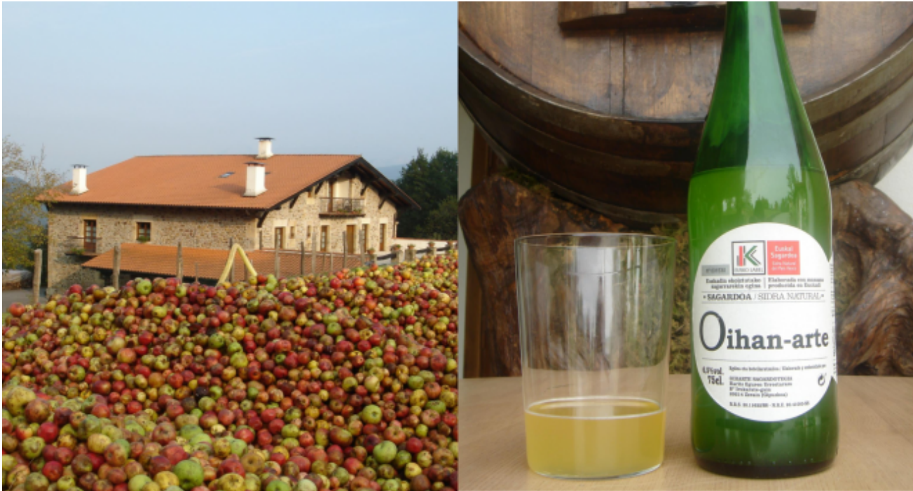
Caserío y sidra de Sidrería Oiharte

Aunque el caserío es del siglo XVII, la sidrería Oiharte es muy joven, empezaron a comercializar sidra en 2010 . Antes, en 2002, ya habían rehabilitaron el caserío para convertirlo en casa rural. Tener la posibilidad de pasar la noche después del txotx es algo muy atractivo. Pero hay más, organizan visitas a la bodega, con posibilidad de disfrutar también del menú y ofrecen un original almuerzo con los sidreros.