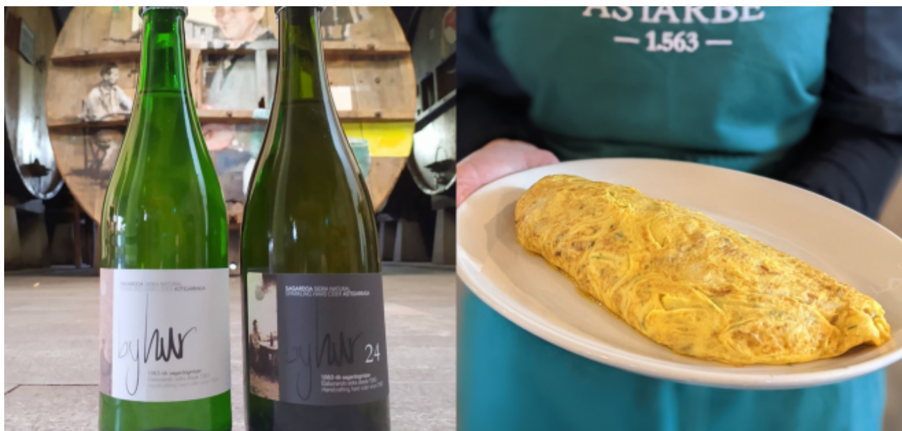
Sidras y tortilla de bacalao de Astarbe