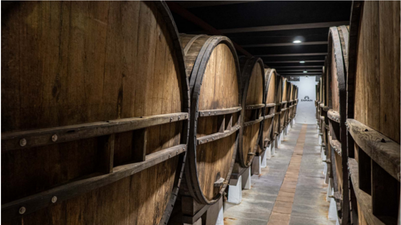
Barricas ( kupelas ) de la Sidrería Zapiain

Tras unos cuatro meses en barrica ( kupela ), a mediados de enero, las sidras están en su punto y ya se pueden catar. Tradicionalmente, los compradores visitaban las sidrerías para probar de las diferentes kupelas y elegir la sidra que comprarían para todo el año. Para no hacer algo tan triste como beber a palo seco, llevaban algo de comer. Durante décadas el bacalao fue el ingrediente principal , frito o en salsa y, con el tiempo, en tortilla y, de postre, dulce de manzana, que no membrillo. Pensad que Guipúzcoa no era tierra de viñedos, sino de manzanos, de ahí la proliferación de sidrerías.