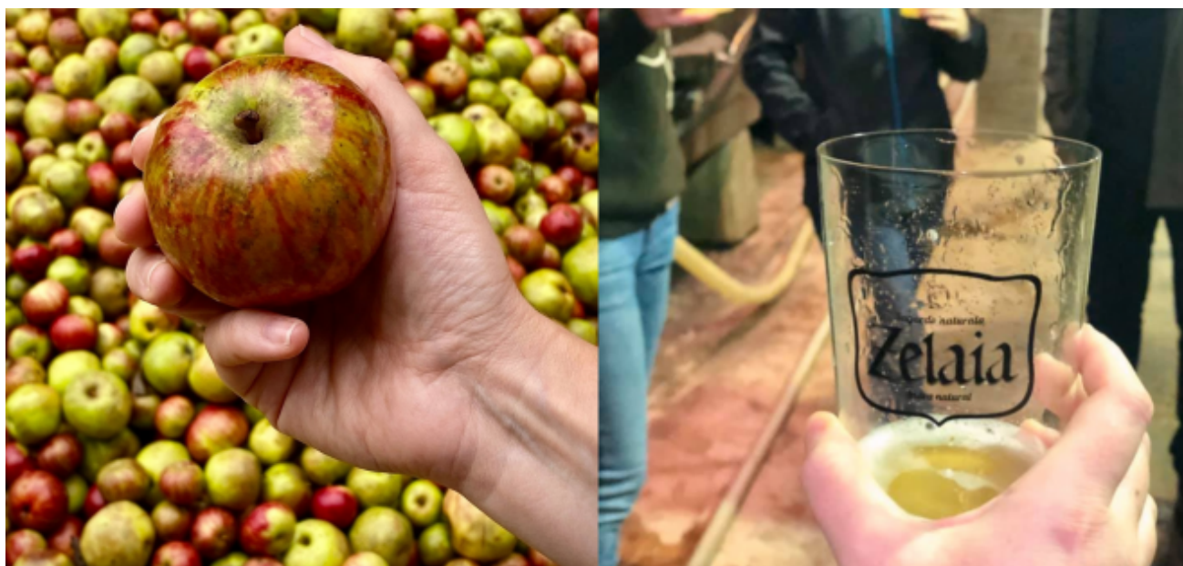
Manzanas y vaso de sidra de Sidrería Zelaia