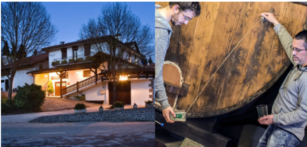
Caserío y txotx en Sidrería Isastegi