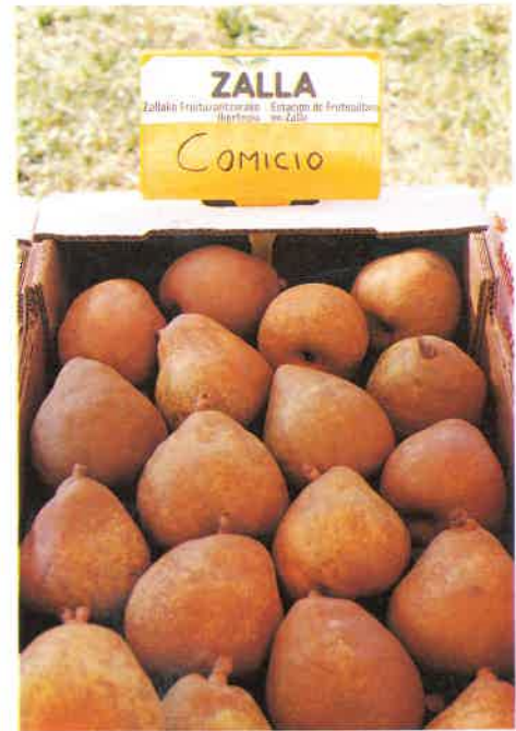
Decana de Komizio-ko udarea.

Barietate hauek ez dute ez plaga ezta gaixotasunekiko minberatasunik azaldu. Osasun egoera, hosto erorketa eta kimuen tratamenduekin, ona izan da.