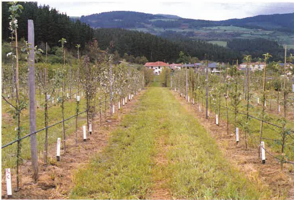
Sagarrondo barietateen landaketa esperimentalak Zallako fruitu-egotegian.

Ureztapenari buruz 20 zentibareak baino gutxiagoko tentsiometro irakurketa-ri dagokion potentzial hidrikoarekin, sakonerako 50 zm-ko horizontea mantentzea gomendatzen da.