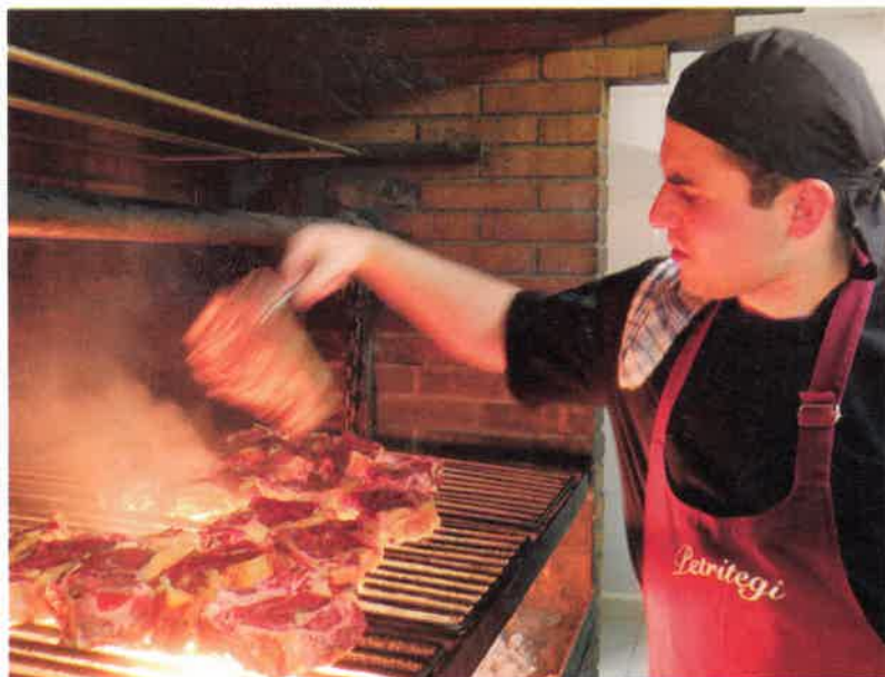
Au menu unique, la fameuse côte de bœuf grillée sur de vives braises de charbon végétal

Vaisseau amiral lancé à la conquête de nouvelles parts de marché dans l'œnotourisme, le musée Sagardoextea, à Astigarraga, propose en plusieurs langues des visites guidées autour de la tradition cidrière et de l'univers passionnant de la pomme et du sagarno. Pommeraie pédagogique, espaces muséographiques et de dégustation... le musée offre également en téléchargement sur son site Internet un outil très pratique de recherche des cidreries du Pays basque. En partenariat avec l'association de producteurs Sagardun, Sagardoextea tente également de diversifier l'offre touristique en proposant des rendez-vous toute l'année autour de l'histoire du cidre. Thème 2012 : « Le cidre et la mer », avec des récits de marins et des balades en mer cet été à Pasajes, à Saint-Sébastien et à Ciboure. Kale Nagusia, 48, 20115 Astigarraga. www.sagardoextea.com . Tél. 00 34 943 550 575. (4 € l'entrée. Fermé le lundi.)