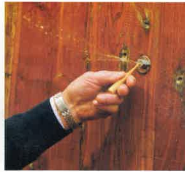
Le txotx (morceau de bois qui obstrue le robinet) est enlevé. Le sagarno coule à flots et la fête peut commencer. L'assemblée se presse autour des kupelas en châtaignier ou en chêne qui contiennent entre 3 000 et 10 000 litres de cidre.