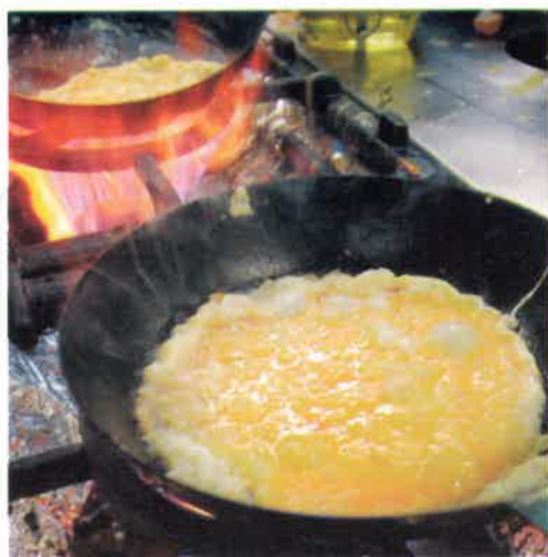
En cuisine, préparation des tortillas