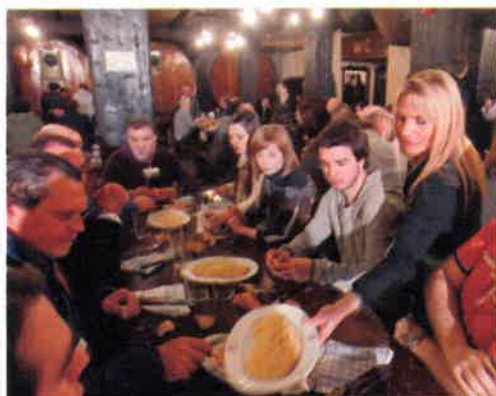
La fête se poursuit autour de longues tablées, où les convives dégustent entre deux verres de cidre de la tortilla à la morue