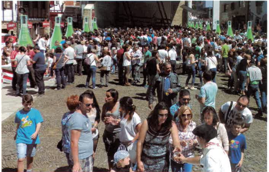
Ea iaeko eguraldi berbera egiten duen aurtengoan.

Hauteskunde giro betean egonda, lerrootan maiatzaren 17an sagardoa herriko alkate izango dugula iragartzea ez da oso txukuna izango agian. Baina Sagardo Egunak urtero biltzen duen jendetza ikusita, edota herritarrek eguna zer nolako irrikaz bizi duten jakinik, ezin esan besterik; badatorrela usurbildarren festa kuttunena. Egunotan, jai egun handirako udalerrria nola apaintzen duten ikusiko dugu. Girotzen hasiko gara. Eta igandean festara. Azken hilabete hauetan prestaketa lanetan aritu diren Sagardo Egunaren Lagunak taldekoen eskutik, urtero moduan, herritar edo herri eragile, talde, elkarre batek izango du, maiatzaren 17ko jaialdia abiatzeko ohorea. Nor edo nortzuk diren ezagutu nahi badituzue, gerturatu igande goizeko 11:30ean frontoira. Eta une horretatik aurrera, denok dantza batean joango zaigun egunaz gozatzeraz: