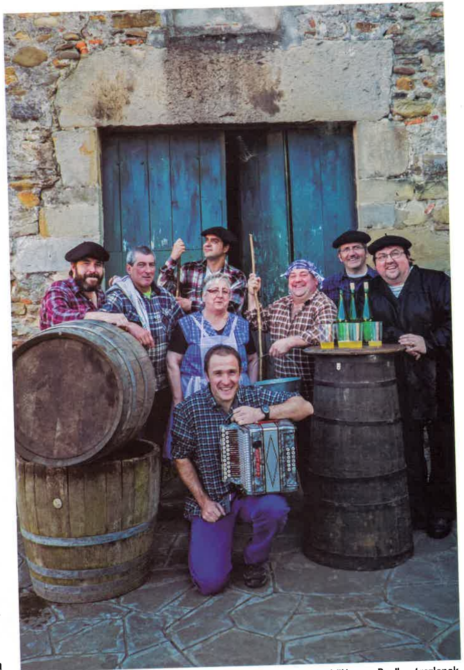
Sagardo Egunerako girotzen hasteko, hitzordu egokia dirudi "Hamen Bea" antzezlanak.