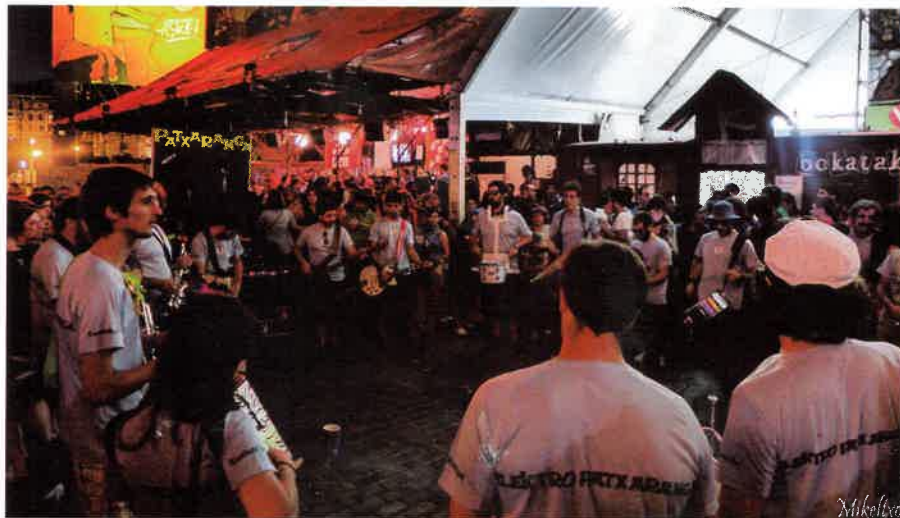
Arratsaldean, Elektro Patxaranga taldekoak arituko dira kalejiran.