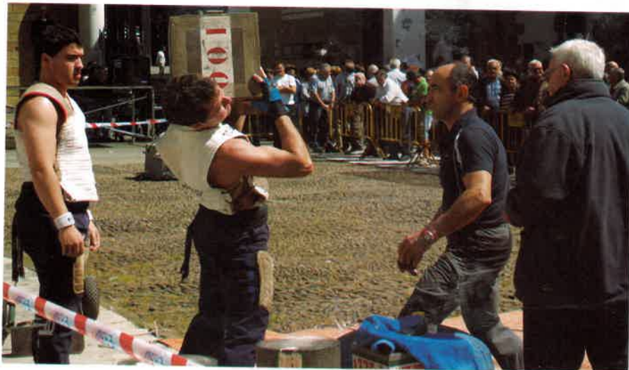
Meza eta gero, hamaiketakoa eta herri kirolak frontoian.