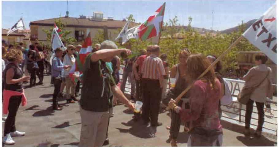
Eguerdian txotx berezia egingo dute. Eta mariskadaren zozketa arratsaldean egingo da.