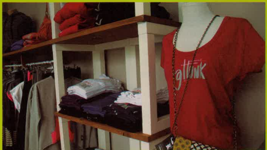
Goizeko 10:30etik 14:00ak arte, zabalik izango da Gattunk denda eta tonbola ondoko stand-a.

Udaberriko kanpaina koloretsu betean den Gattunk Denda zabalik izango da XXXIV. Sagardo Egunean. Goizeko 10:30etik arratsaldeko 14:00ak arte, #Kilometroak15 ekimeneko materiala ikusi eta erosteko aukera ezin ederragoa izango duzue beraz. Ez dendan bakarrik, baita Gattunk Tonbola ondoan, hau da, Argilan saltoki parean jarriko duten postuan ere. Postura gerturatu eta gustuko arroparen bat ikusiz gero, ez kezkatu. Zabalik izango den dendako aldageletan probatu ahalko duzue eta.