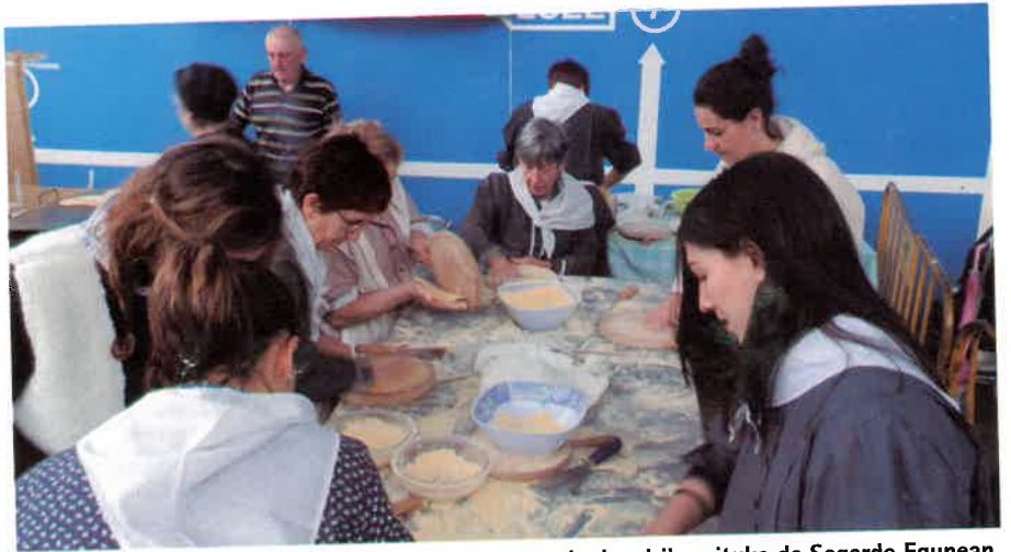
20 laguneko koadrila arituko da Sagardo Egunean.

Kide bat baino gehiago bilgunea osatu zutenetik gaur arte jardunean izan direnez, Usurbilgo talde beteranoe-na edo ibilbide luzeenetarikoak jorratu duena desegitera doala esan dezakegu. Aurreko astekarian berri eman genizuen. Urtean zehar Usurbilen ospatu izan diren azoka edo jai egun nagusietan, festa erdian izan ditugu, ekimentera gerturaturikoei, hamaiketako goxo askoa prestatzen. Mimo handiz eskuz eginiko zenbat talo jan ote dira udalerrri honetan, lanerako prestutasun osoa erakutsi izan duen herritar talde bati esker.