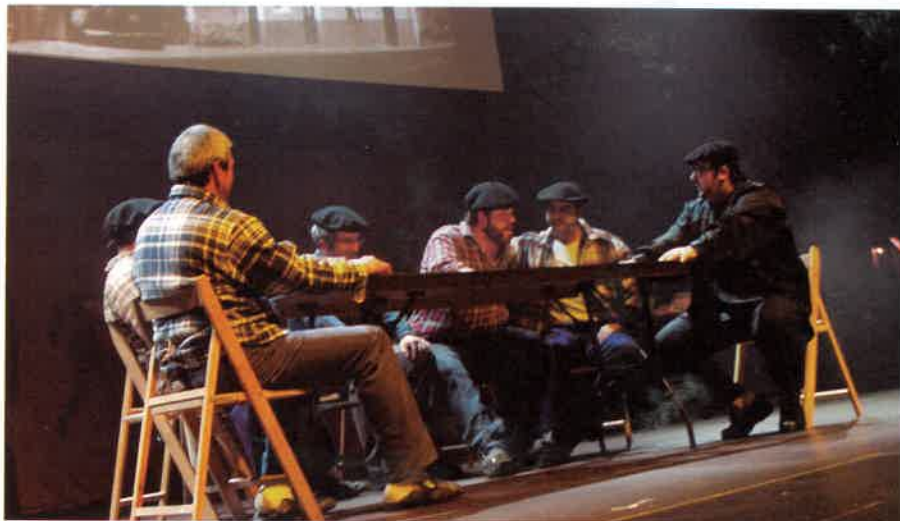
#Kilometroak15-eko jaialdian eskainitakoari segida emango diote larunbat honetan.

■ Sarrera: 3 eurotan Lizardin eta Txirristran.