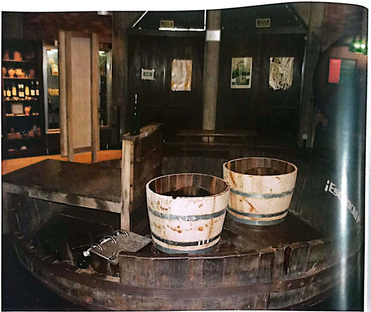
Enriba, una de les pieces más emblemátiques del muséu de la Sidre d'Asturies.

museo "quiere ser un elemento representativo de la identidad asturiana y una plataforma de promoción integral, además de tener una mayor presencia a lo largo de toda la región, tiene que dar cabida a otras manifestaciones identitarias de la región".